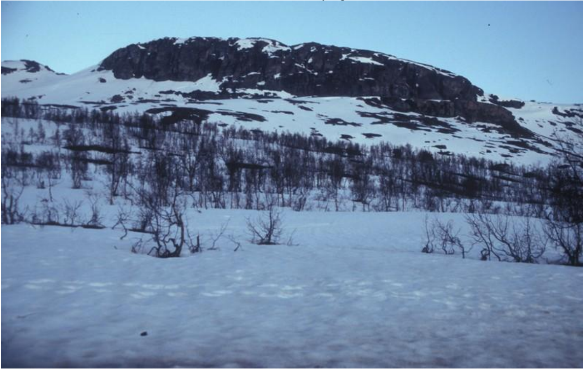
Photos 62 à 65 Paysages