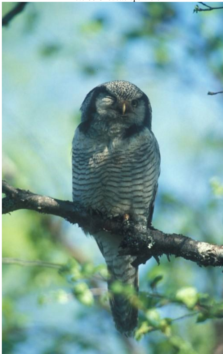
Photo 67 Juvénile de Chouette épervière