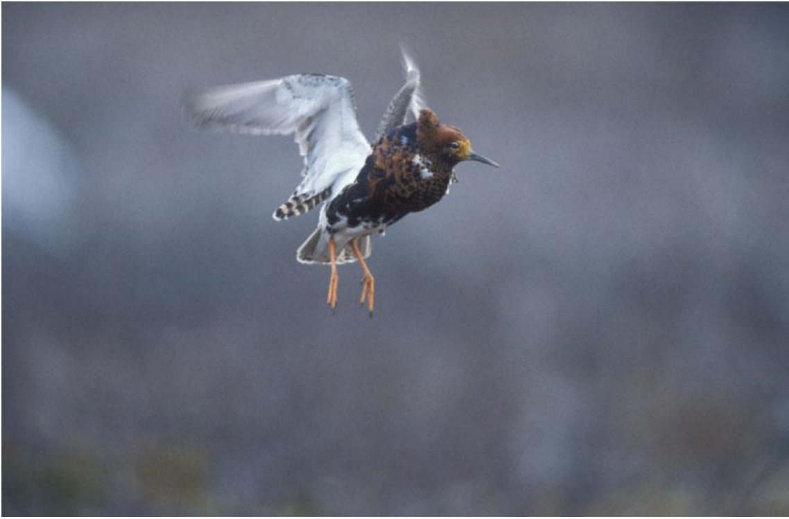
Photos 52 à 56 Mâles de Combattant varié dans une tempête de neige