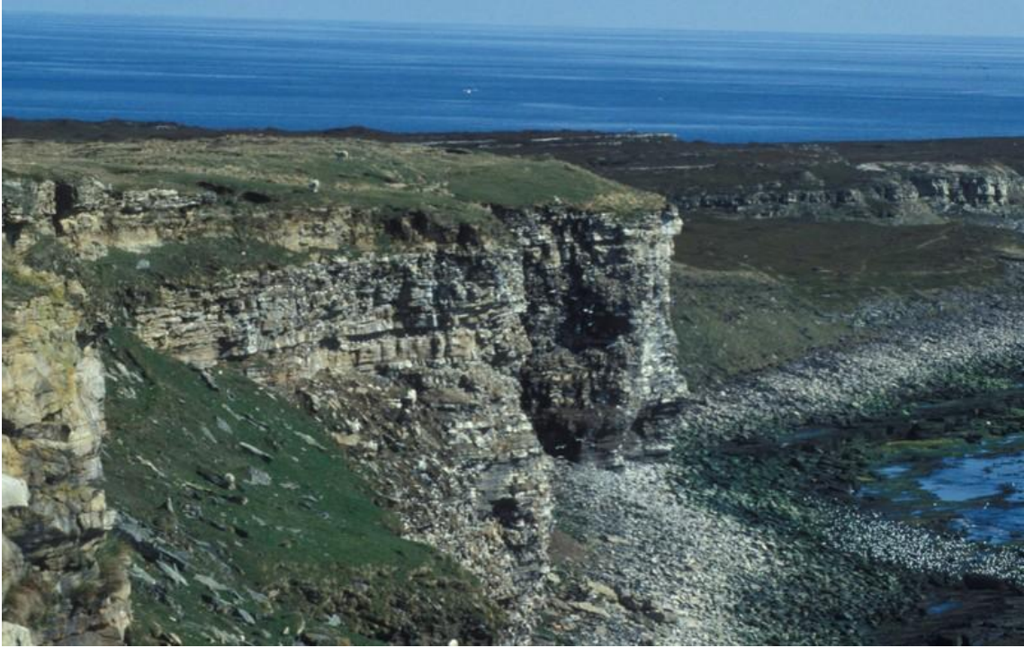
Photos 42 et 43 Bécasseau maubèche à Ekkeroy