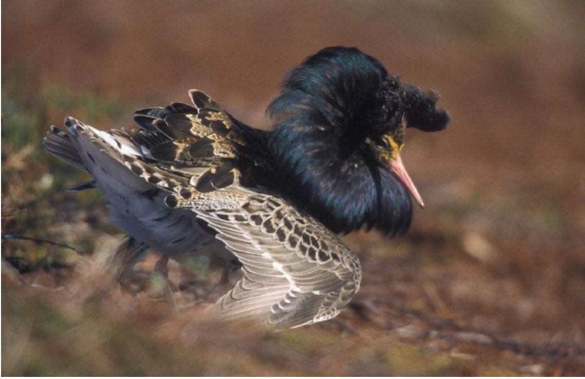
Photo 47 à 51 Mâles de Combattant varié