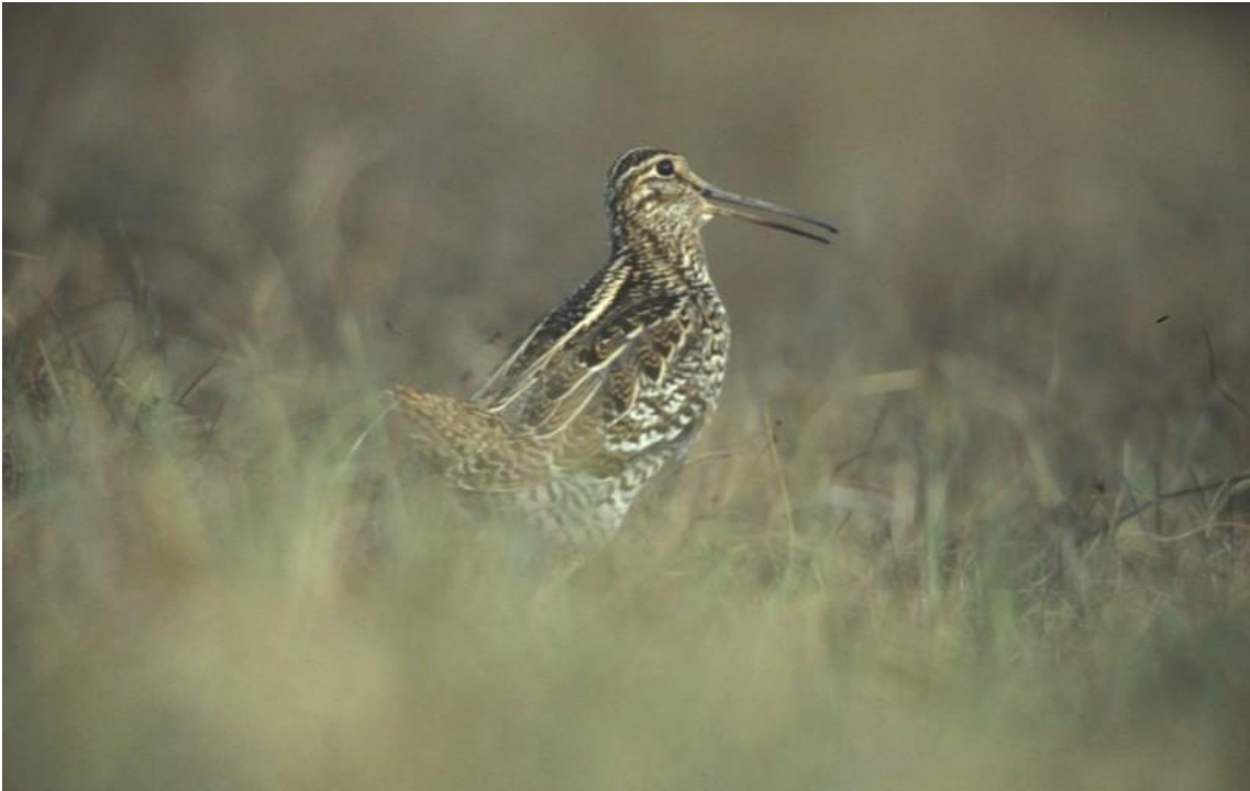
Photos 68 à 73 Bécassine double

Et par chance, le temps est un peu plus clair au Flatruet et je peux poser mon affût. J'y passe 2 nuits avec une dizaine de Bécassines doubles sur le lek. Hormis cette espèce, j'observe notamment la Bécassine des marais, le Lagopède des saules et le Hibou des marais.