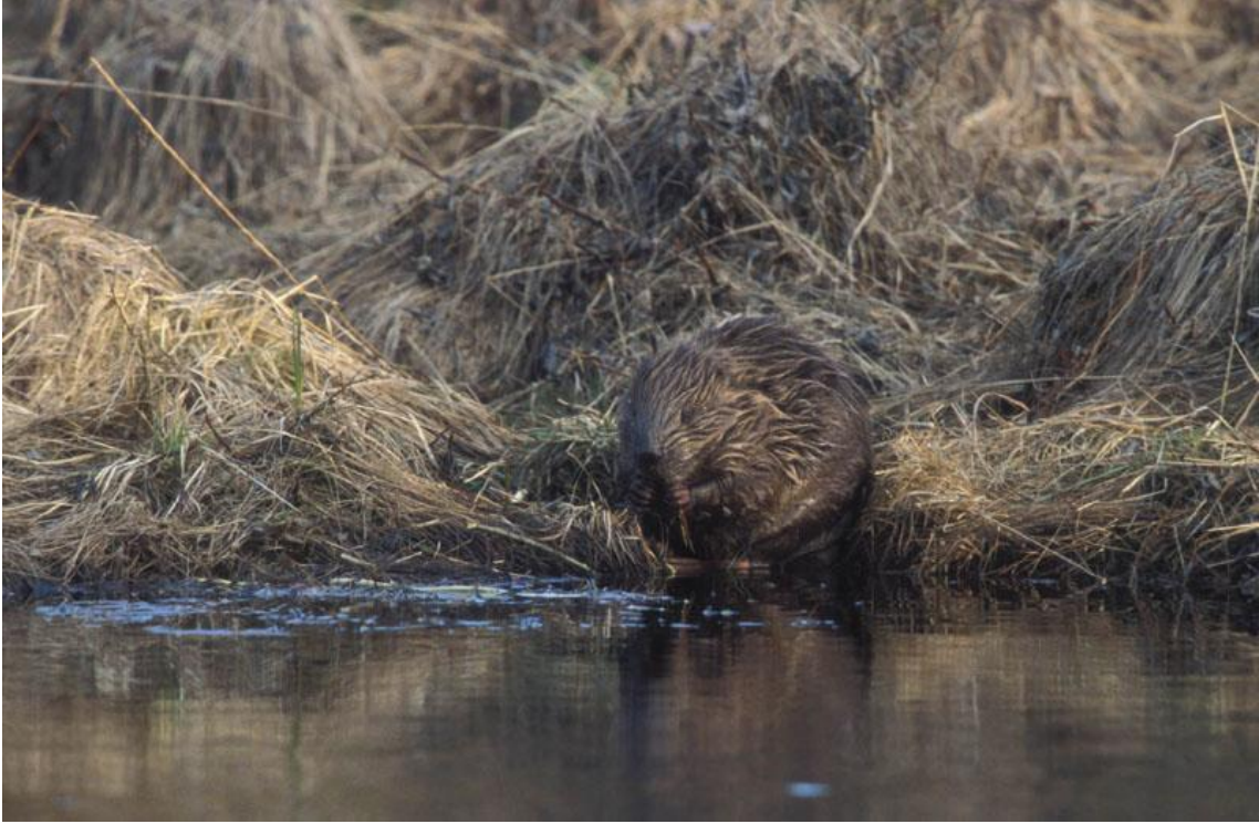
Photos 74 à 76 Castor d'Europe