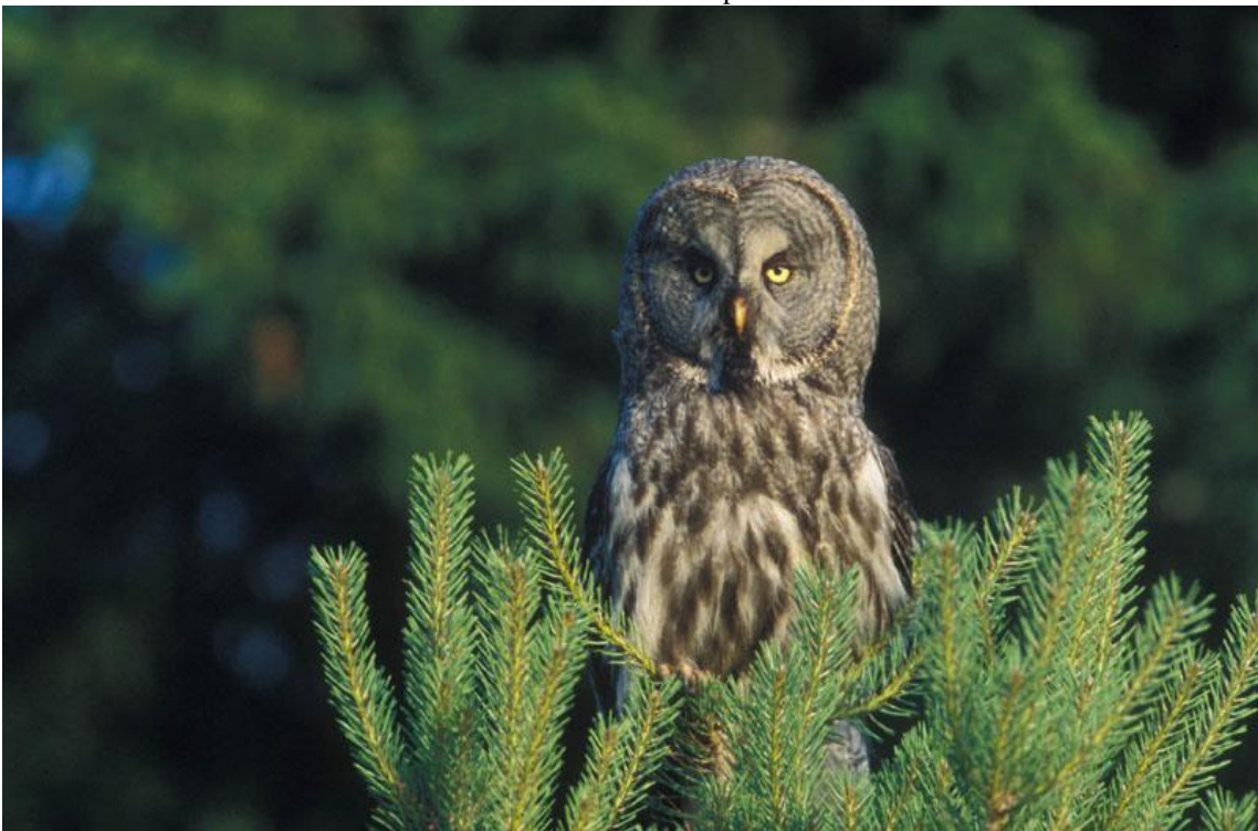
Photo 77 Chouette lapone

Dans les alentours de Mora, je vérifie un nid de Chouette lapone et trouve 3 jeunes qui sont déjà hors du nid.