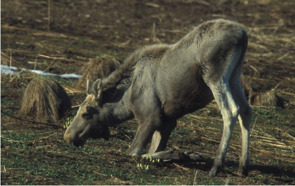
Photo 37 Elan

Sur le plateau, la neige est encore très présente et recouvre la totalité des montagnes et tous les lacs sont gelés. Du coup, peu d'oiseaux à part quelques passereaux (Sizerin flammé, Alouette haussecol et Bruant des neiges).