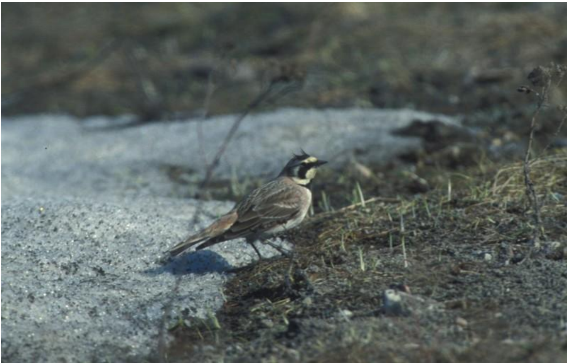
Photo 38 Alouette hausse-col

Sur le plateau, la neige est encore très présente et recouvre la totalité des montagnes et tous les lacs sont gelés. Du coup, peu d'oiseaux à part quelques passereaux (Sizerin flammé, Alouette haussecol et Bruant des neiges).