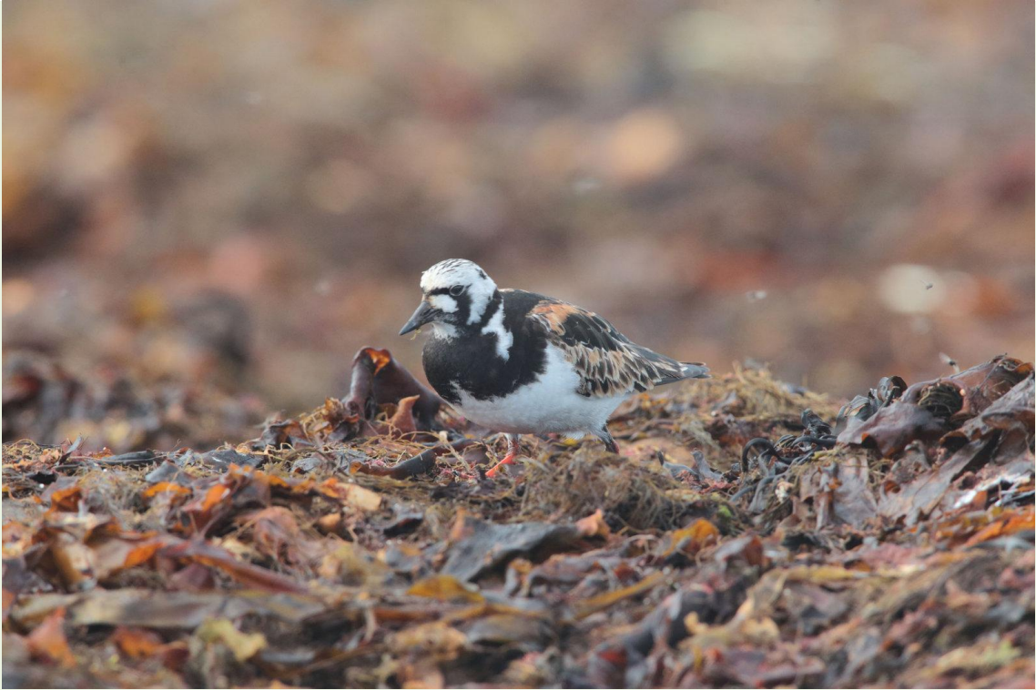
317 - Tournepierre à collier