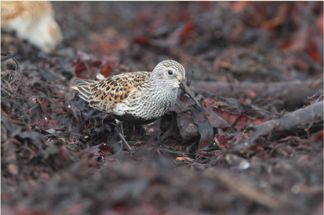
316 - Bécasseau variable