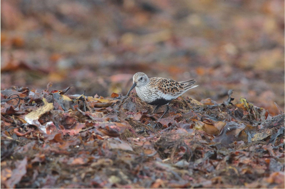
313 - Bécasseau variable