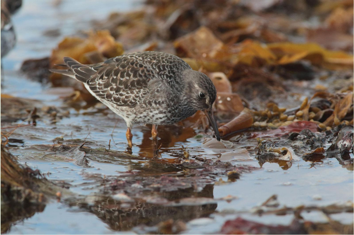
311 – Bécasseau violet