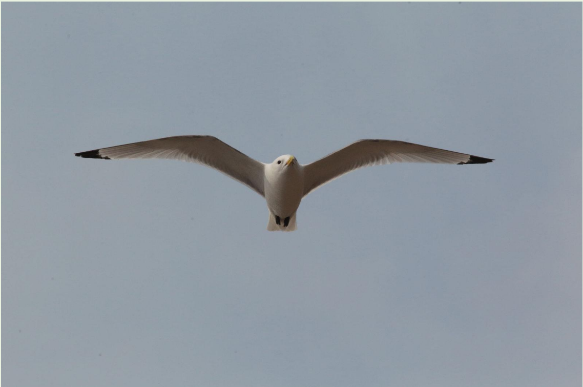
298 - Mouette tridactyle