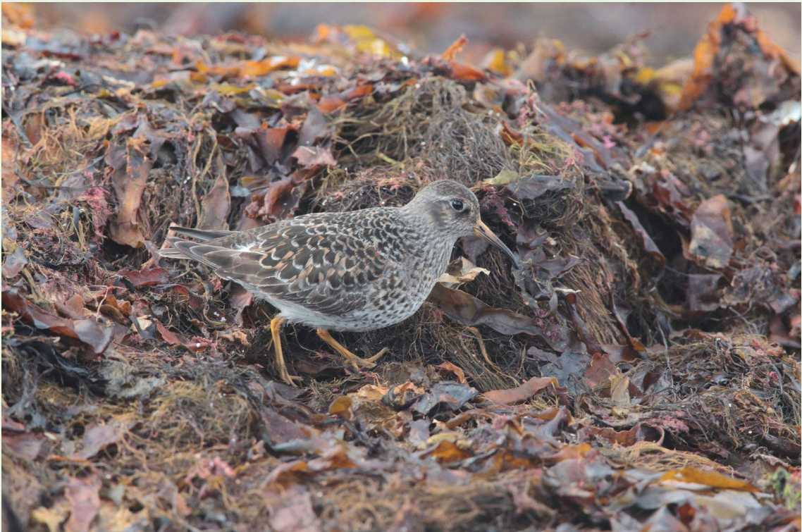
310 – Bécasseau violet