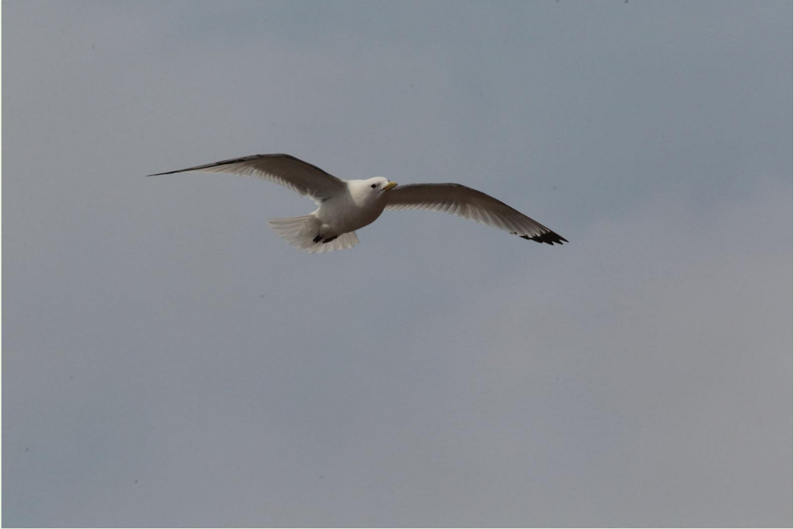
297 - Mouette tridactyle