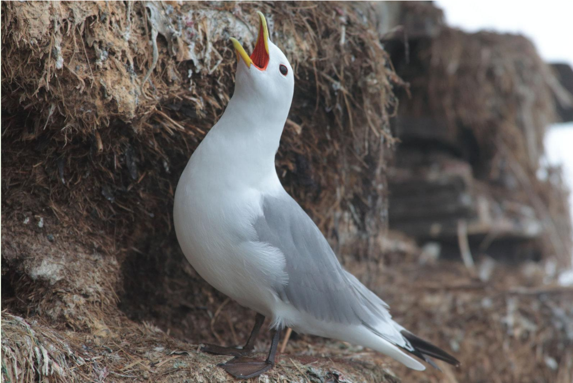
295 - Mouette tridactyle