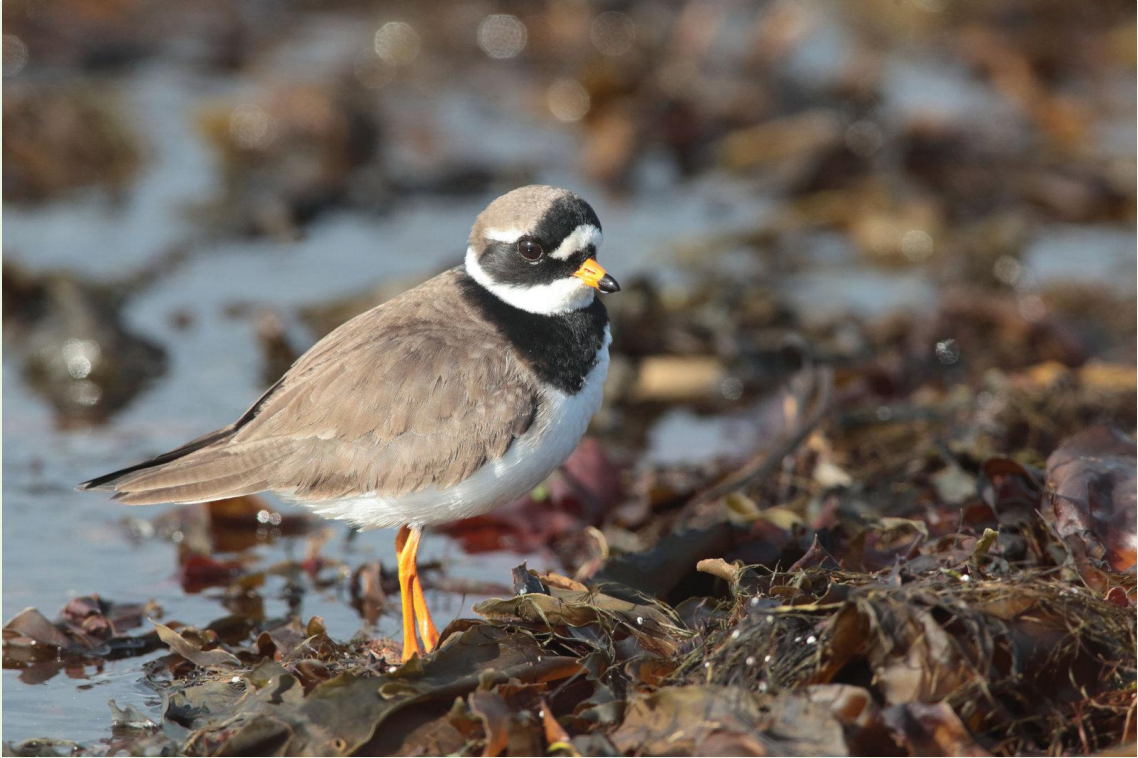
307 – Grand Gravelot