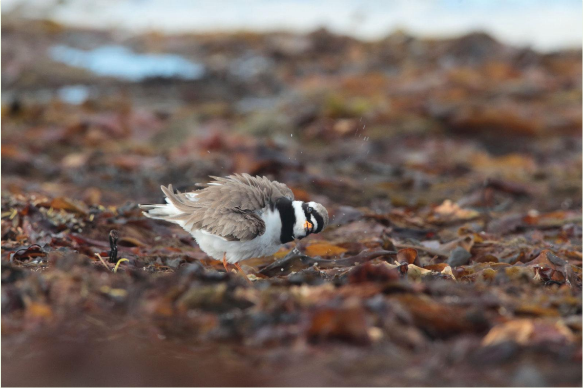
305 – Grand Gravelot