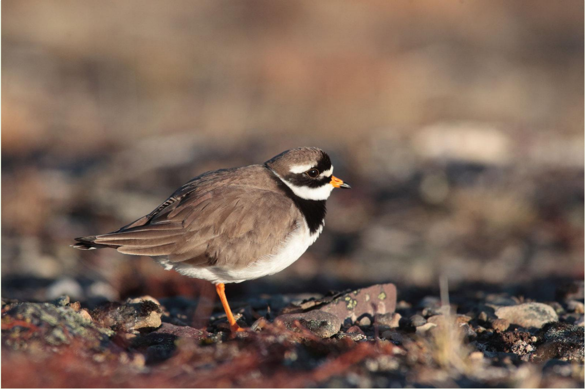
303 – Grand Gravelot