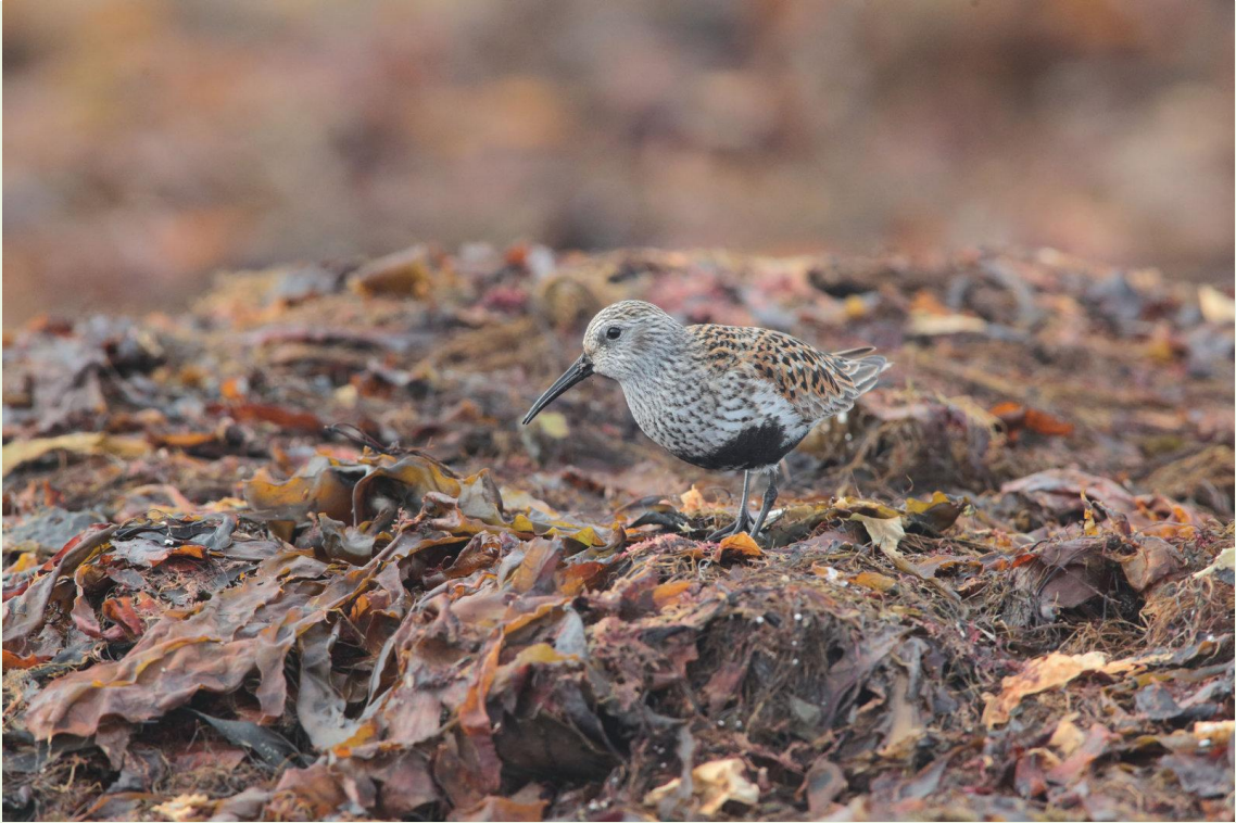
315 - Bécasseau variable