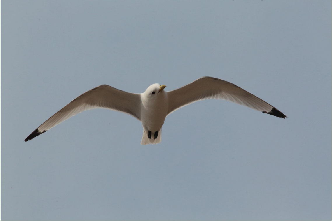
299 - Mouette tridactyle