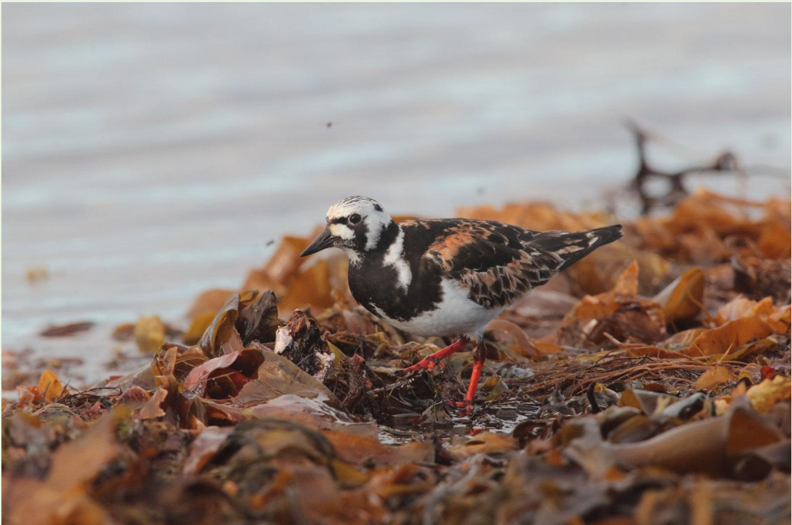
318 - Tournepierre à collier