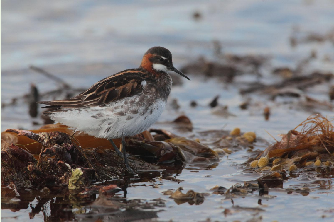
319 - Phalarope à bec étroit