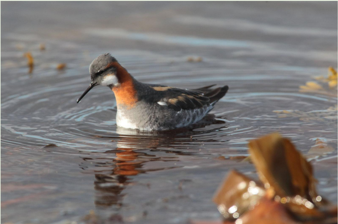
320 - Phalarope à bec étroit