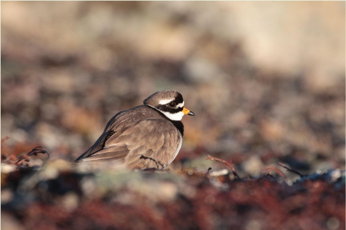
302 - Grand Gravelot