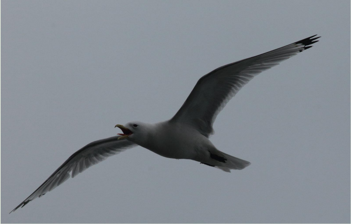
301 - Goéland argenté