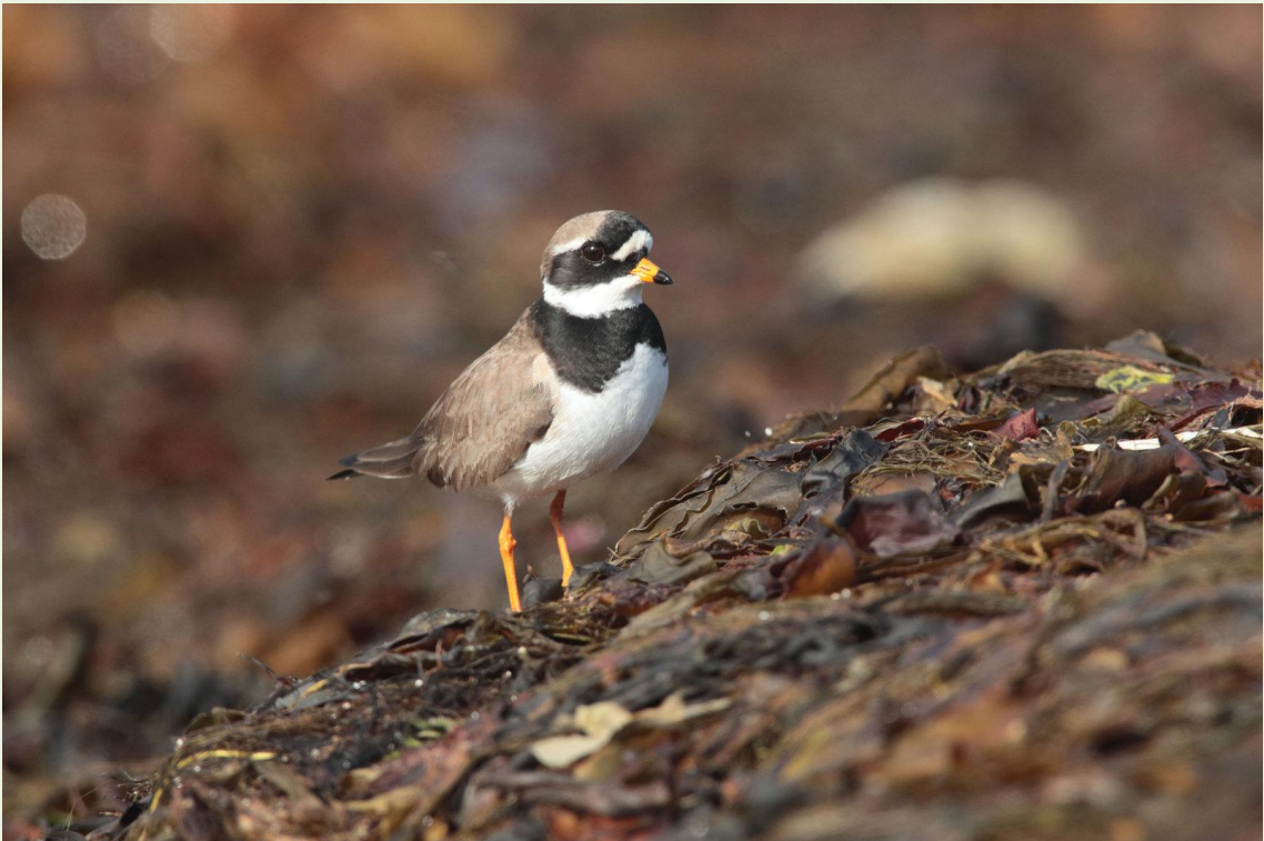
306 – Grand Gravelot