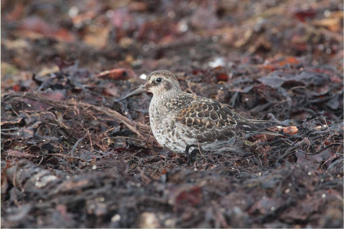
309 – Bécasseau violet