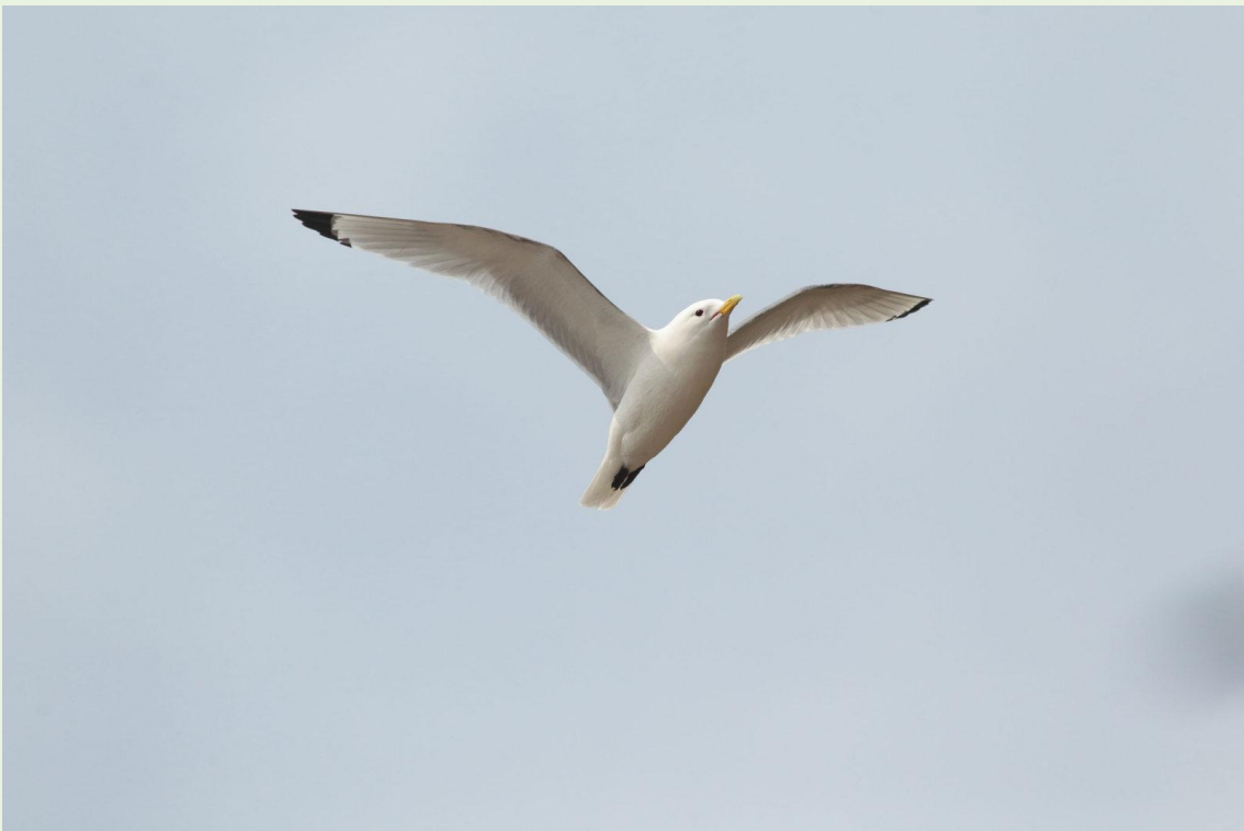
296 - Mouette tridactyle