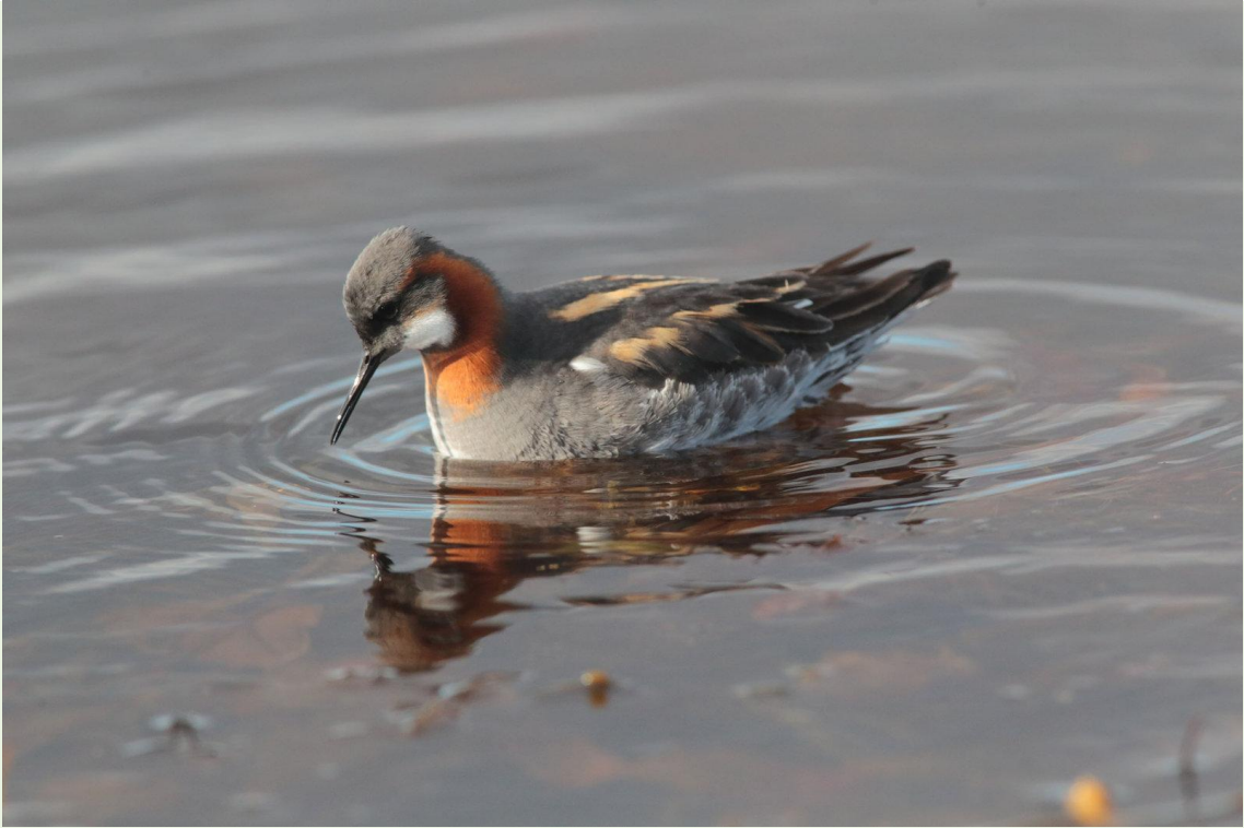
321 - Phalarope à bec étroit