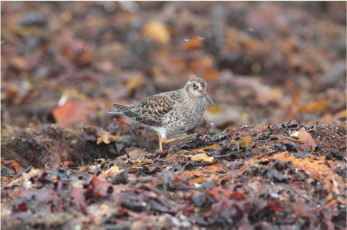
308 – Bécasseau violet