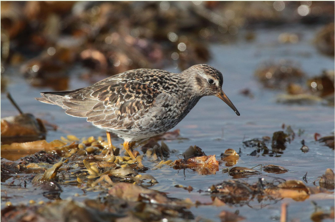
312 – Bécasseau violet