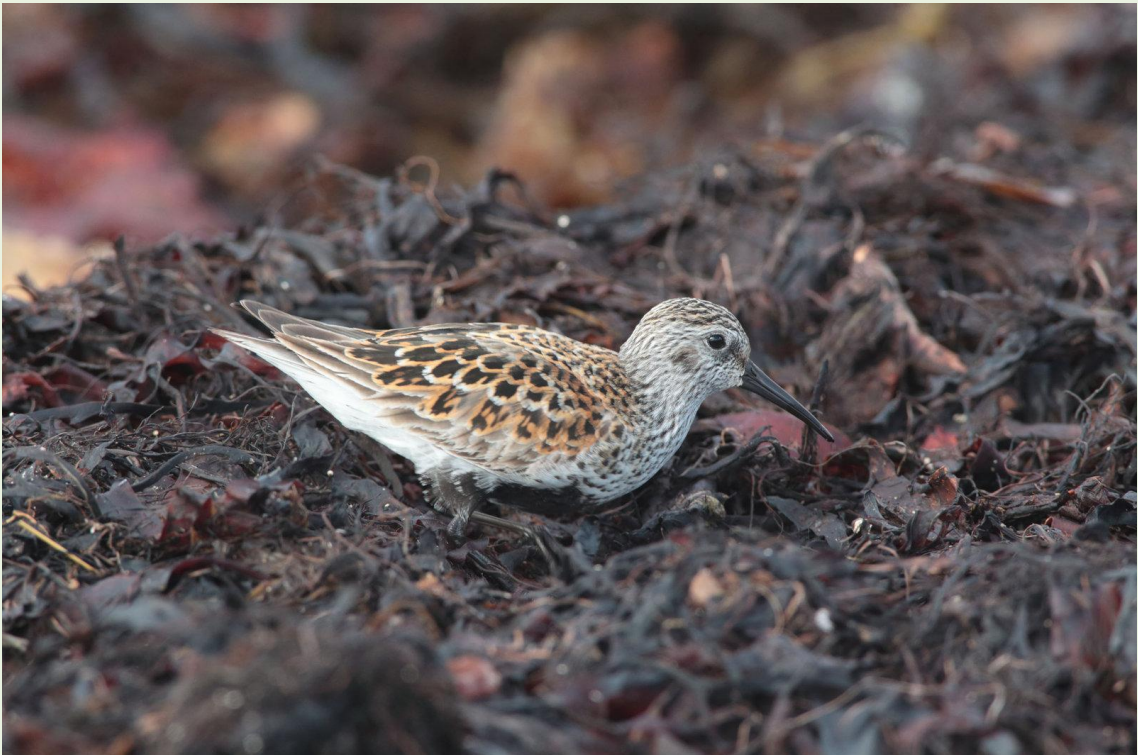
314 - Bécasseau variable