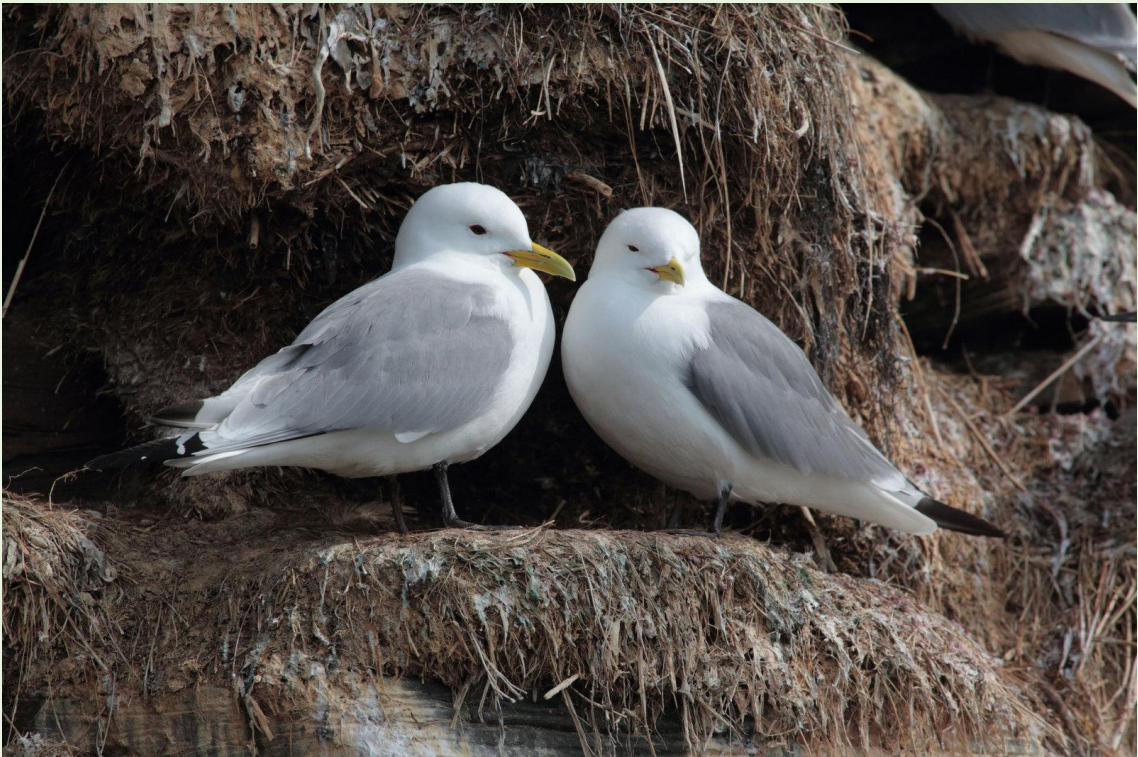
300 - Mouette tridactyle