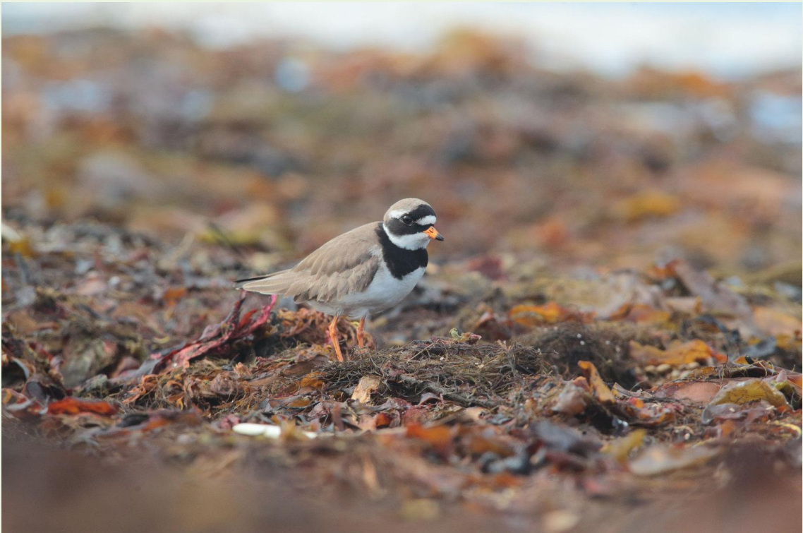
304 – Grand Gravelot