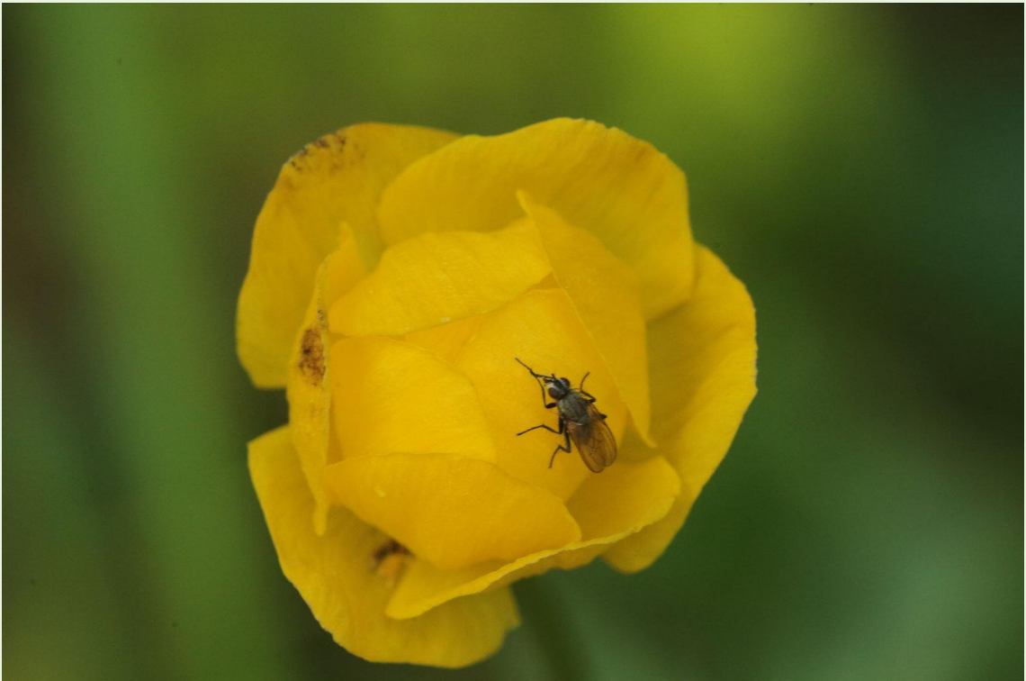
474 - Trollius europaeus