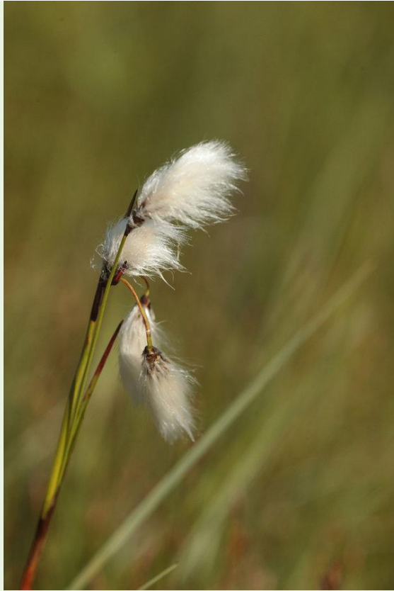
479 - Eriophorum angustifolium