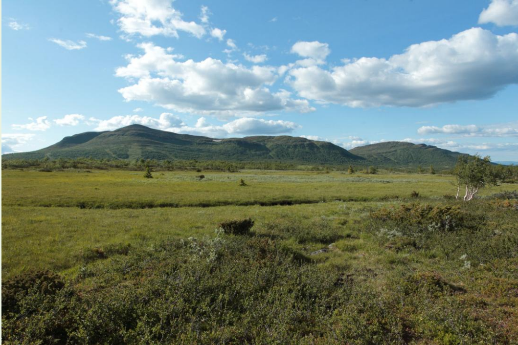
461 - Vue de la réserve d'Ansätten

Au niveau faune, j'ai rencontré notamment plusieurs mâles et une femelle avec 3 jeunes de Lagopède alpin et Brachyta interrogationis . Bonne journée Jean-Marc