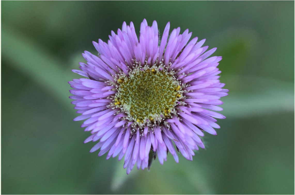
481 - Erigeron sp