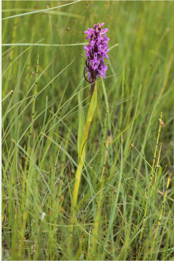
471 - Dactylorhiza incarnata