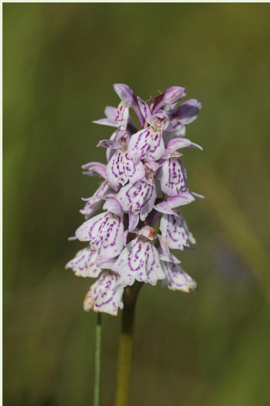
468 - Dactylorhiza maculata