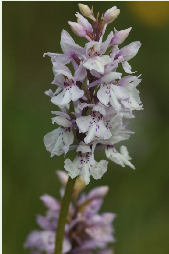
470 - Dactylorhiza fuchsii