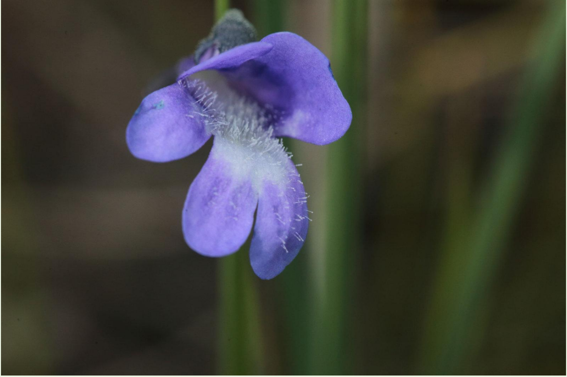
469 - Pinguicula vulgaris