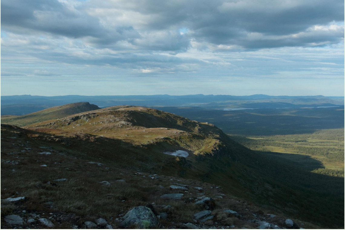
463 - Vue depuis le sommet d'Ansätten