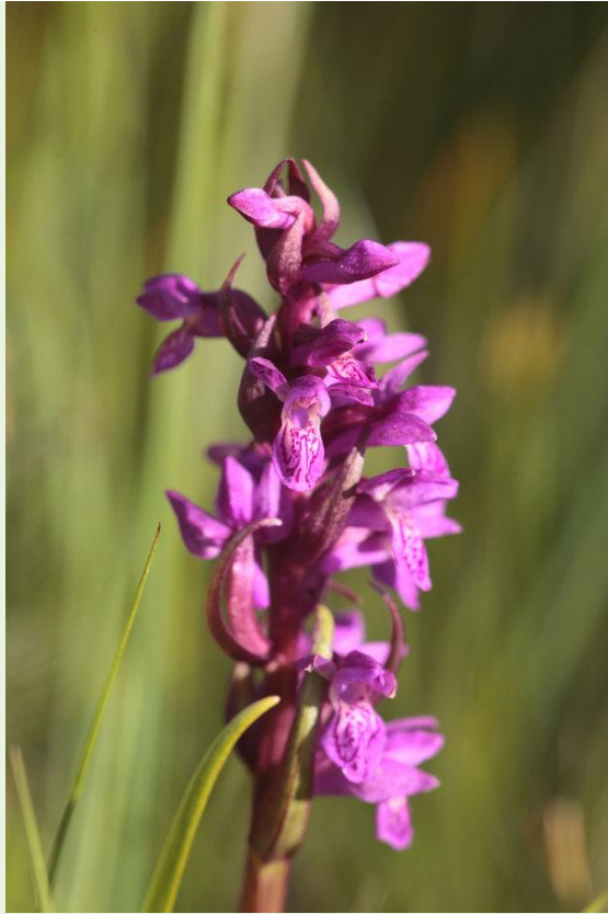
467 - Dactylorhiza lapponica