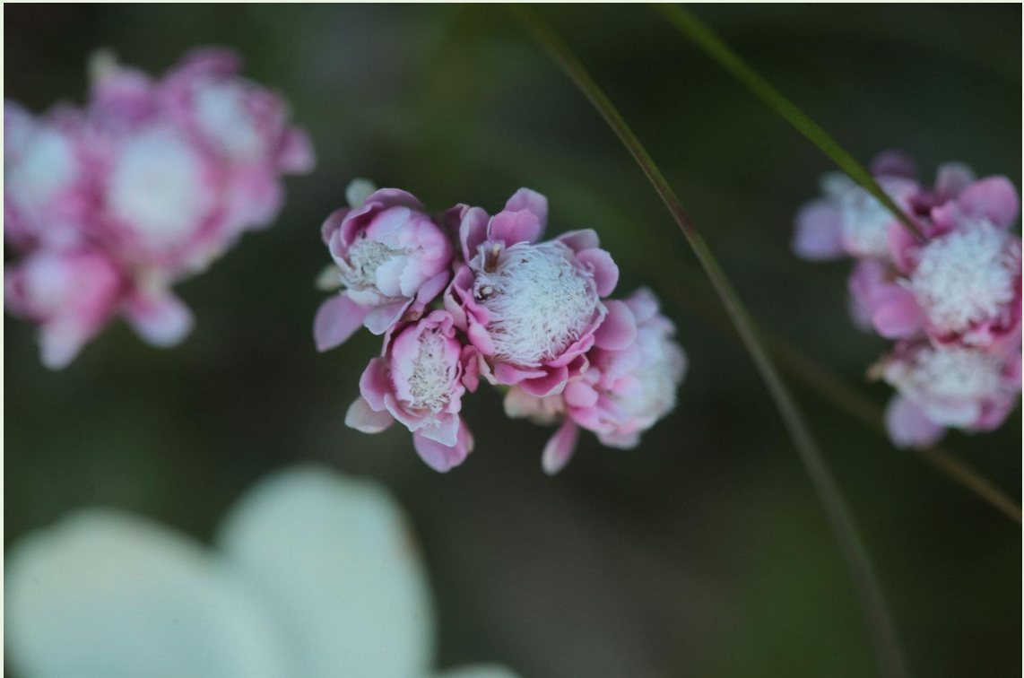
482 - Antennaria dioica