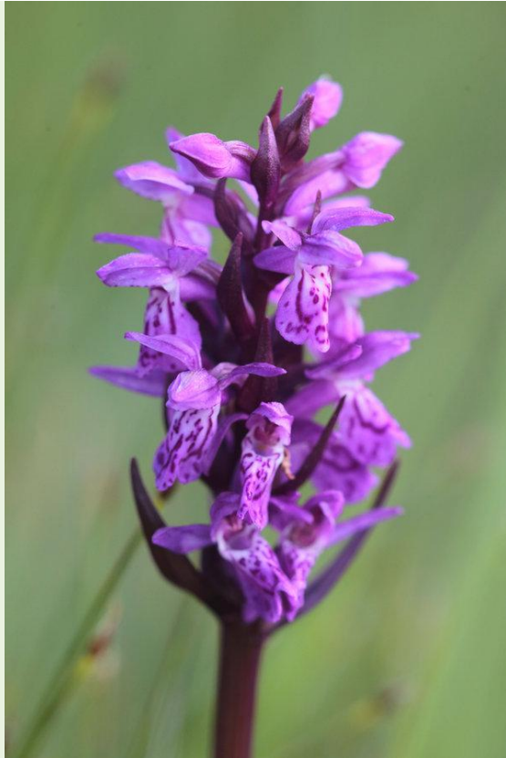
465 - Dactylorhiza lapponica