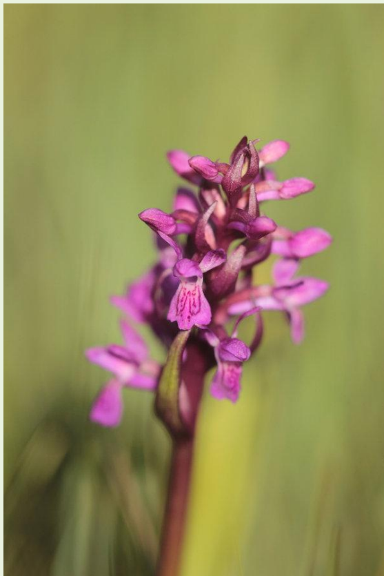
476 - Dactylorhiza cruenta