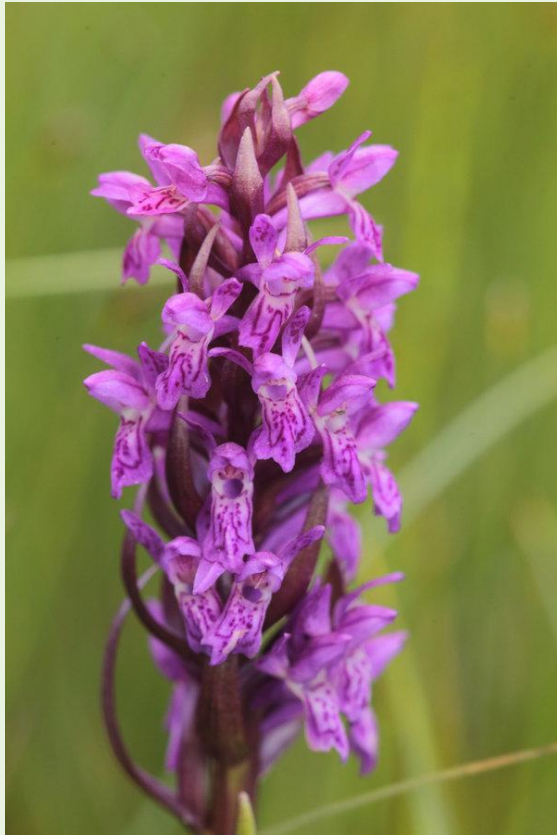
472 - Dactylorhiza incarnata