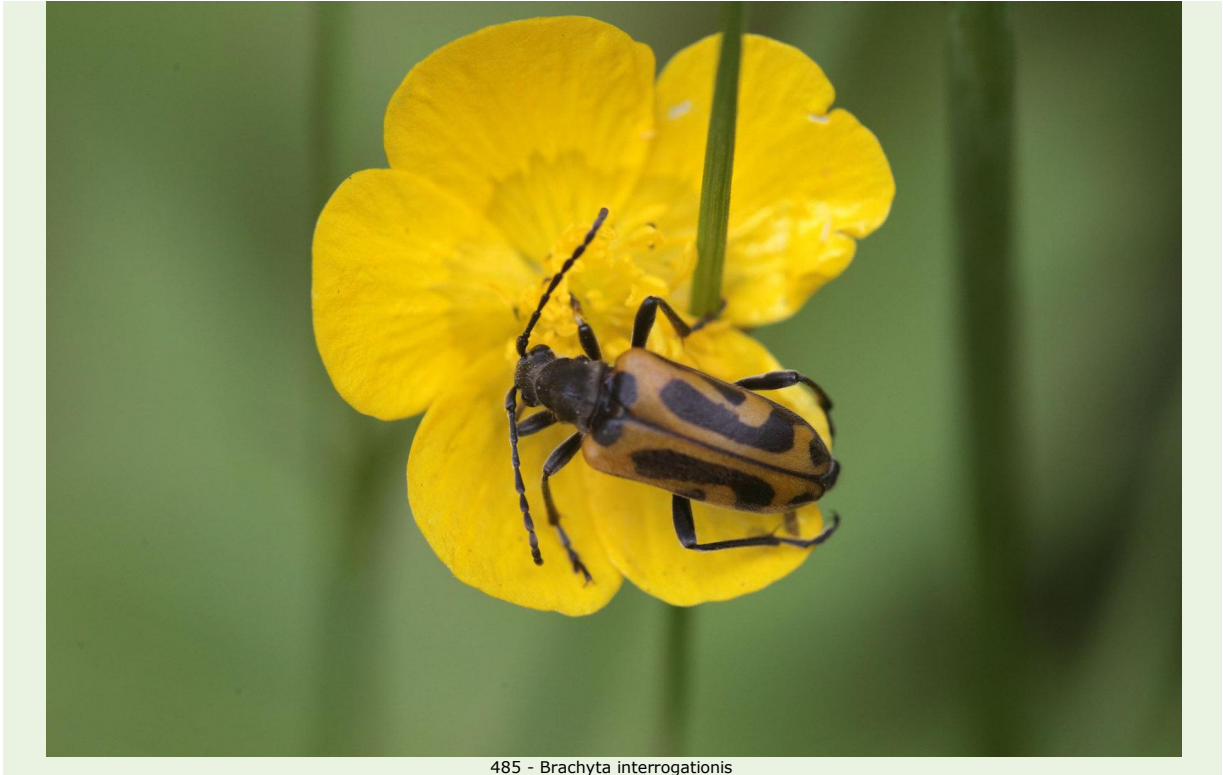
485 - Brachyta interrogationis