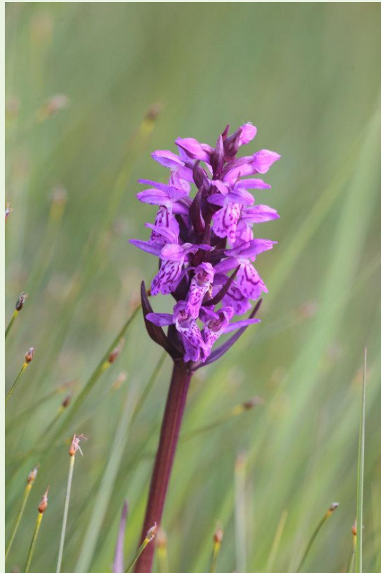
464 - Dactylorhiza lapponica