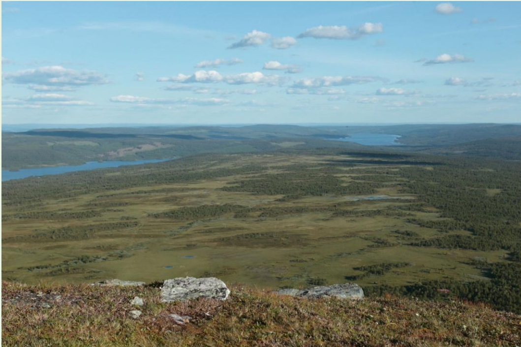
462 - Vue depuis le sommet d'Ansätten