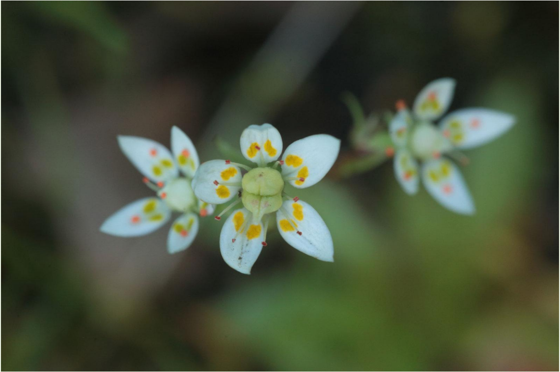
473 - Saxifraga stellaris