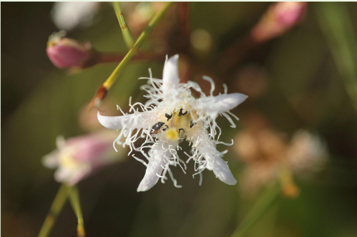
480 - Menyanthes trifoliata