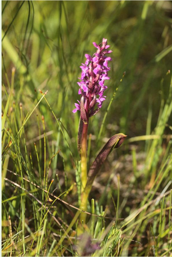
475 - Dactylorhiza cruenta