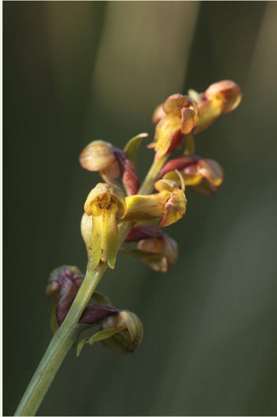
483 - Coeloglossum viride