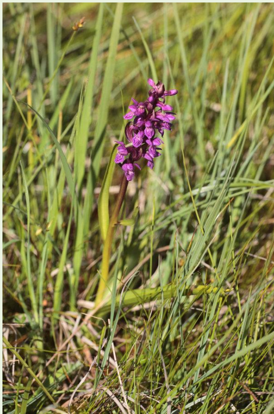
466 - Dactylorhiza lapponica