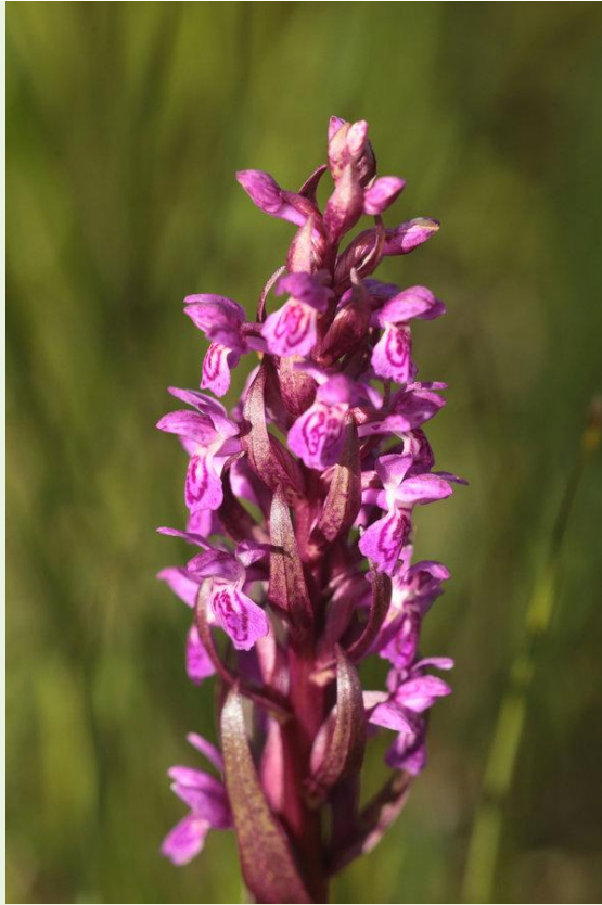
477 - Dactylorhiza incarnata