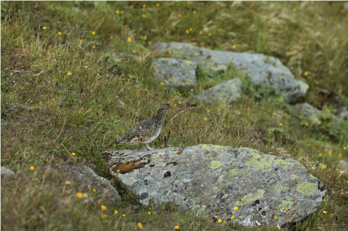
484 - Lagopède alpin