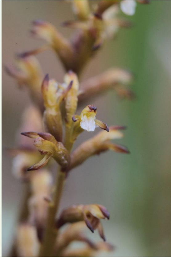
567 - Corallorrhiza trifida