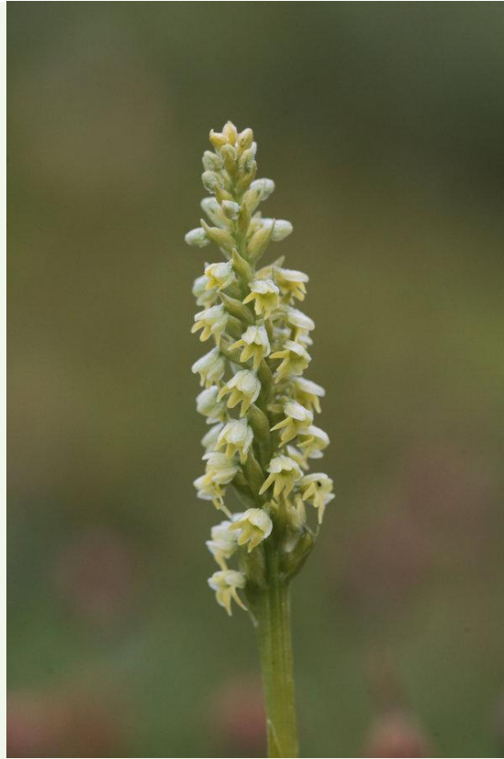
565 - Pseudorchis straminea

Pour terminer le séjour au Varanger début juillet 2019, un peu de botanique avec des orchidées ( Pseudorchis albida tricuspis , Corallorrhiza trifida , Coeloglossum viride et Neottia cordata ), d'autres plantes et du Saumon en train de remonter une rivière. Bonne journée Jean-Marc