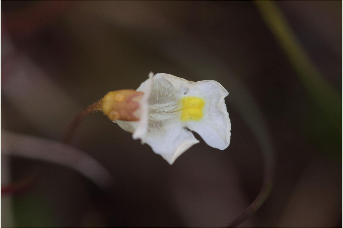
581 - Pinguicula alpina