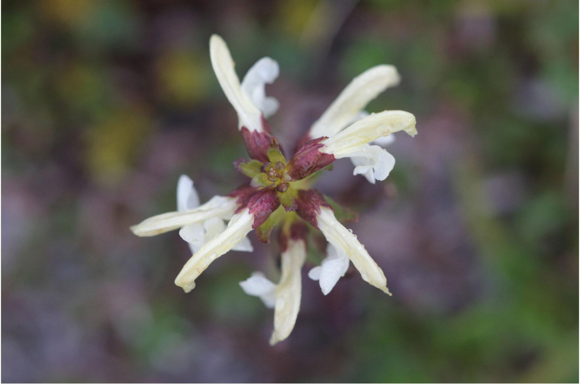
575 - Pedicularia lapponica