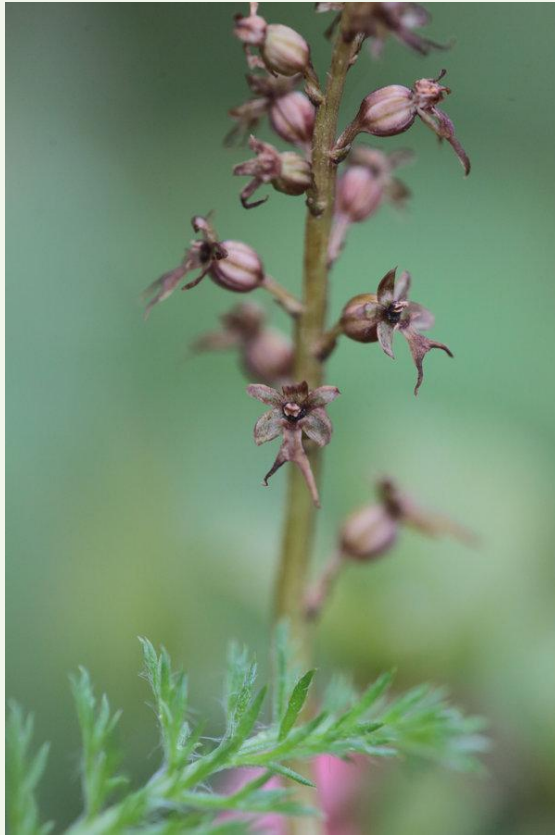
572 - Neottia cordata