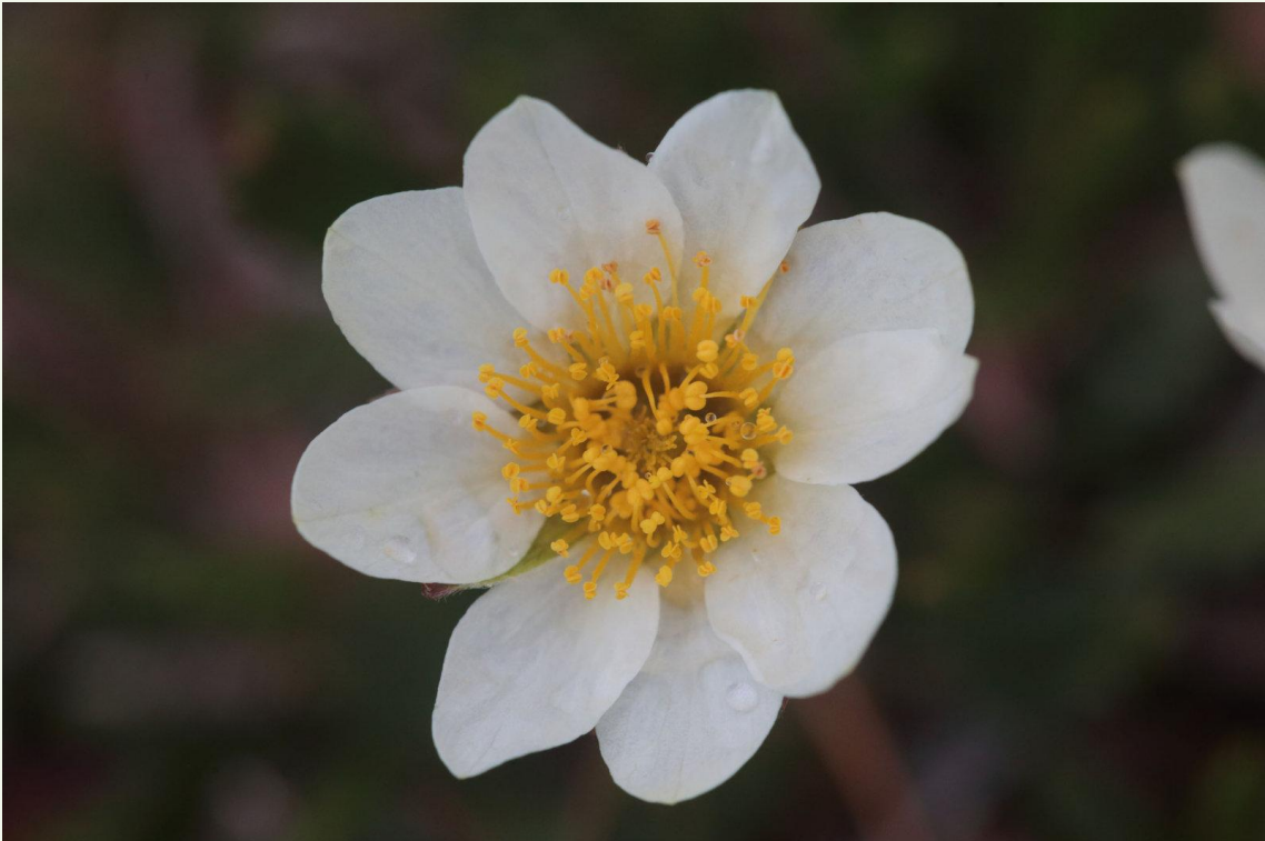
574 - Dryade