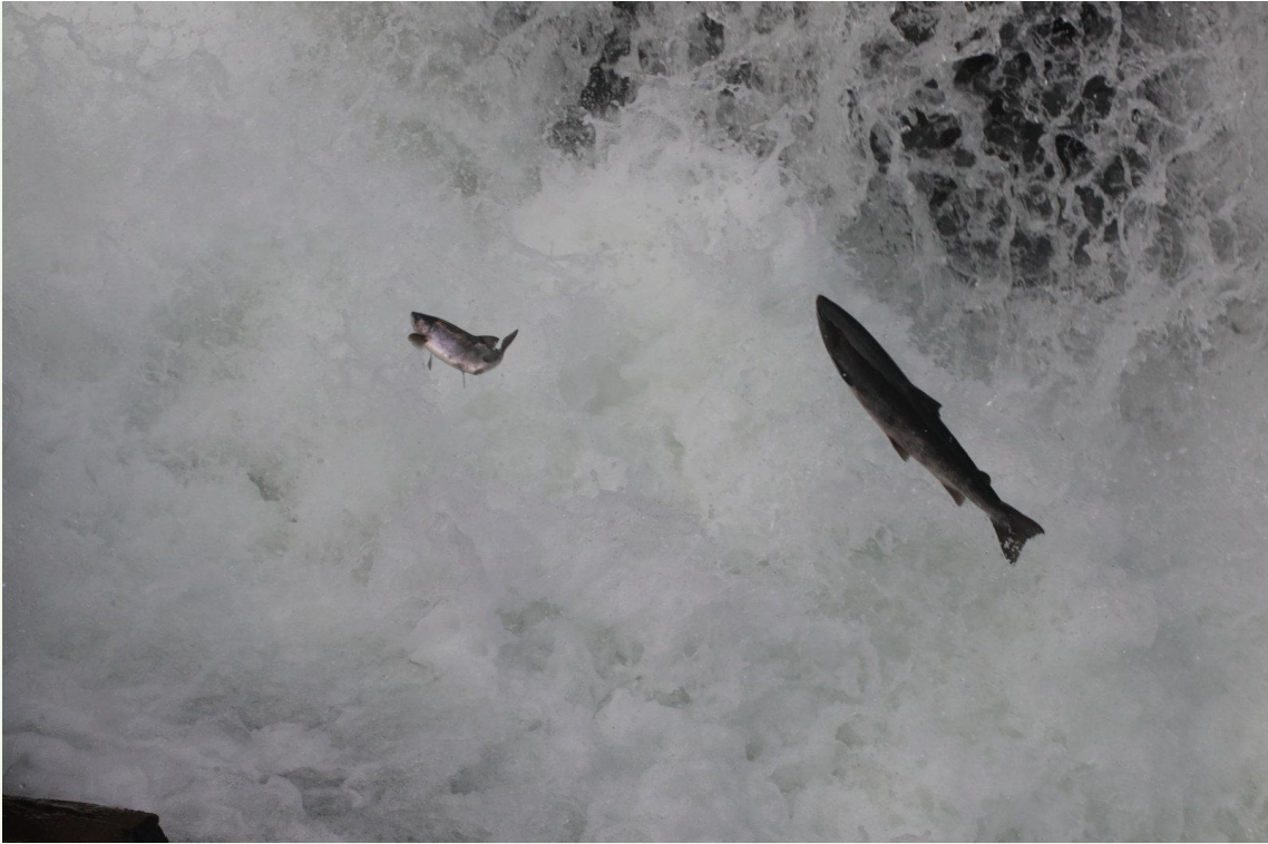
583 - Saumon