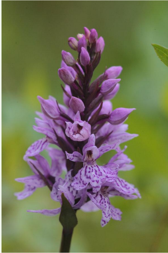
569 - Dactylorhiza maculata montellii