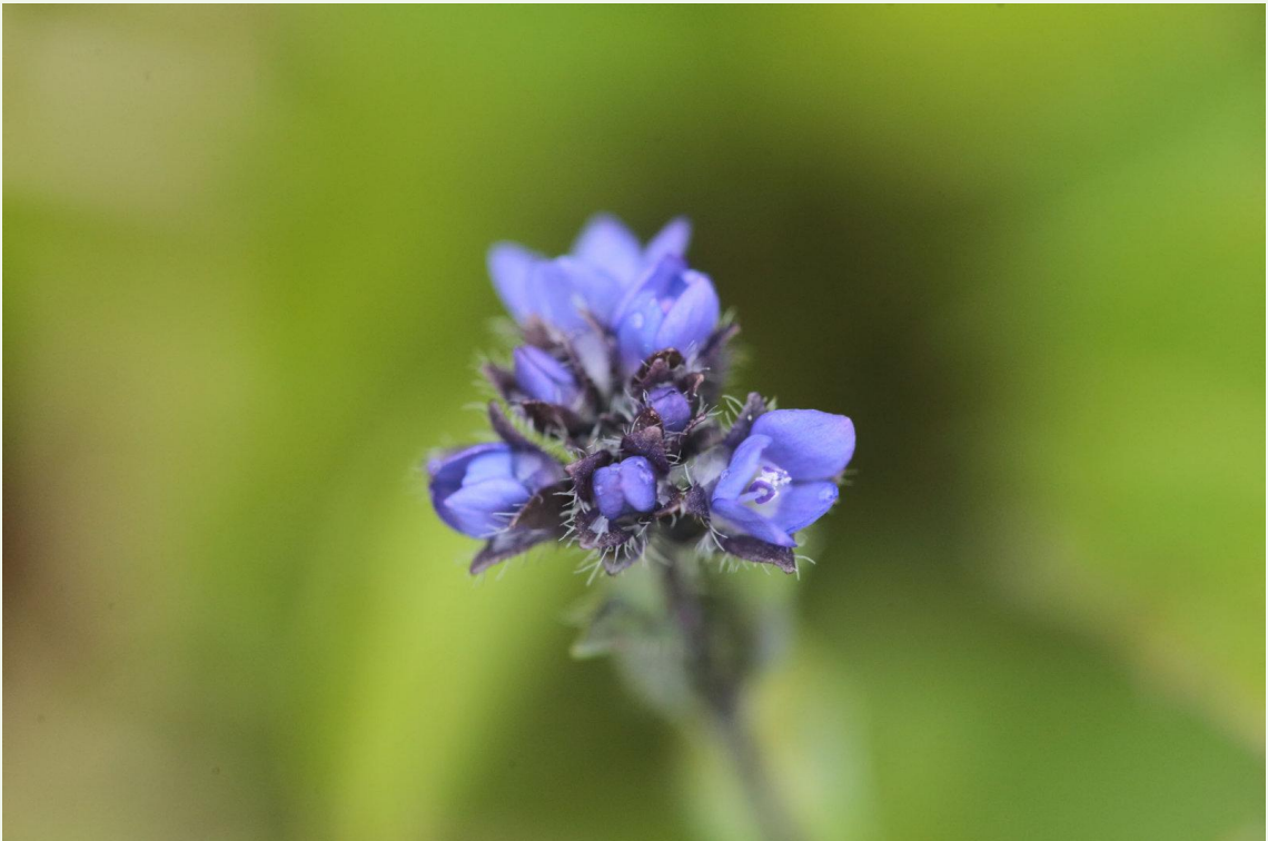
580 - Veronica alpina