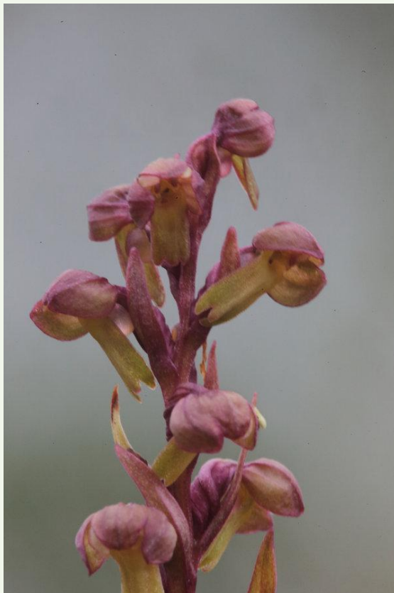
570 - Coeloglossum viride