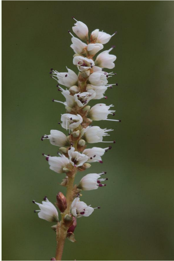
573 - Bistorta officinalis