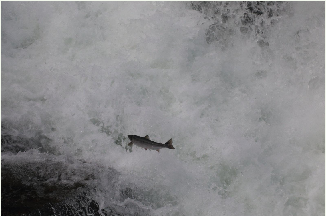
582 - Saumon