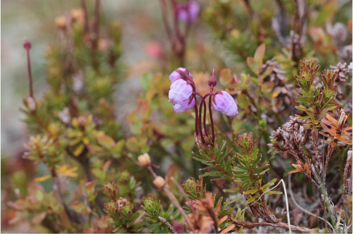
579 - Phyllodoce caerulea