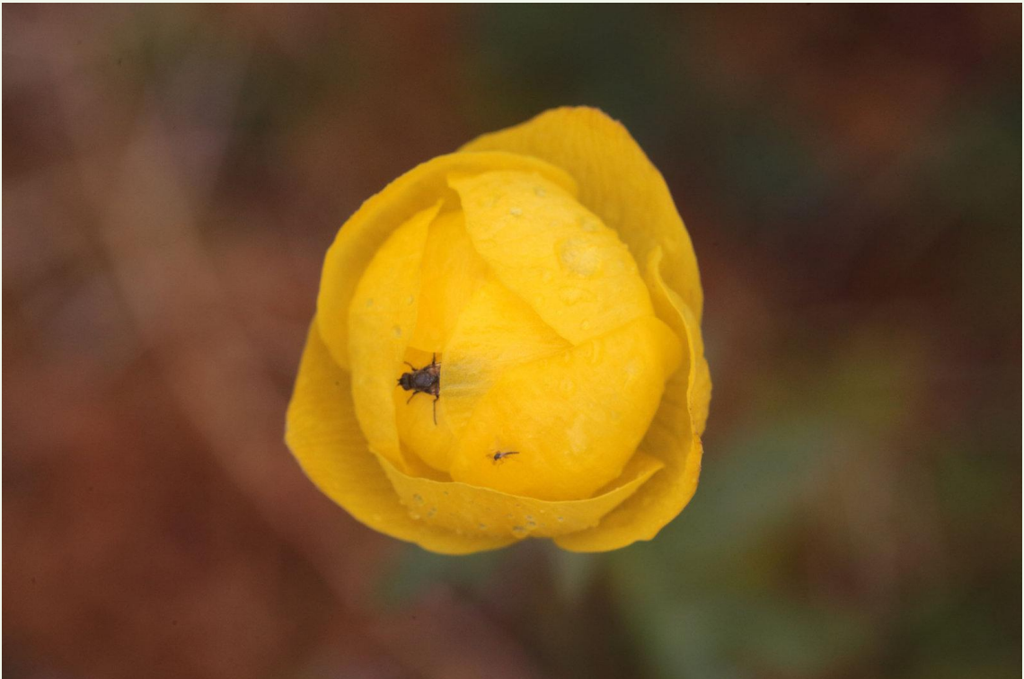
578 - Trollius europaeus