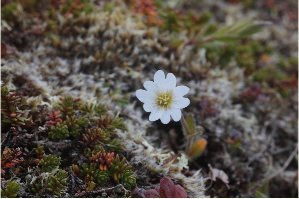
577 - Cerastium alpina