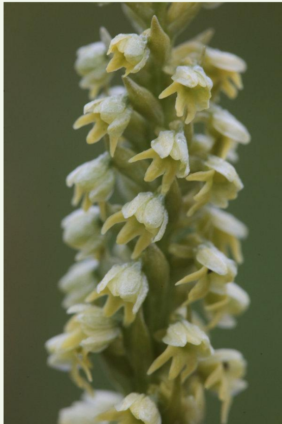
566 - Pseudorchis straminea