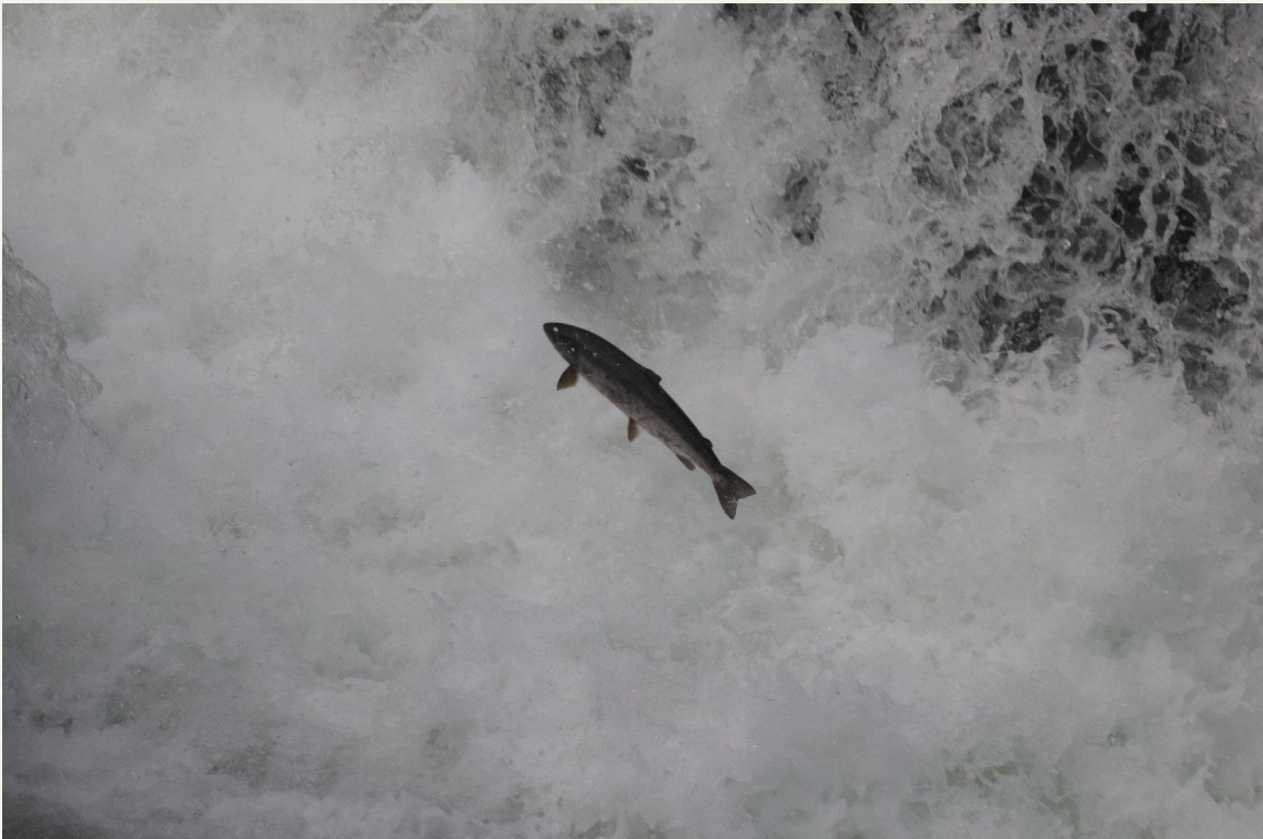
584 - Saumon