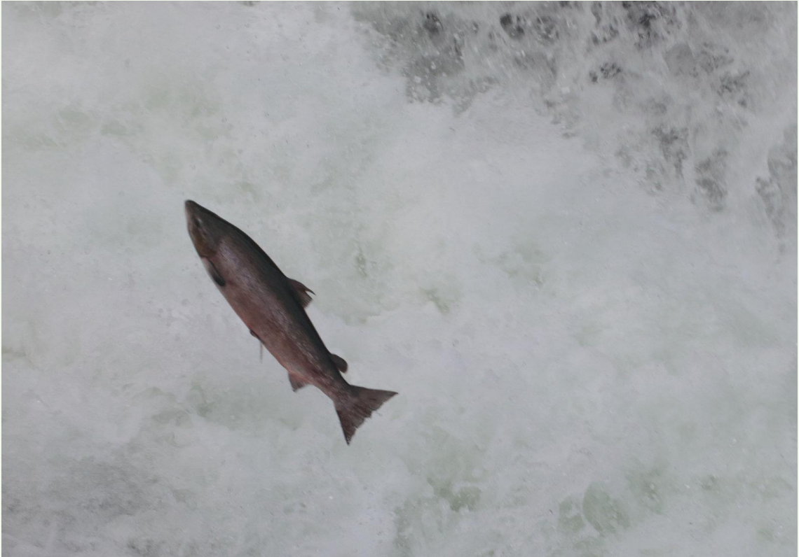
585 - Saumon