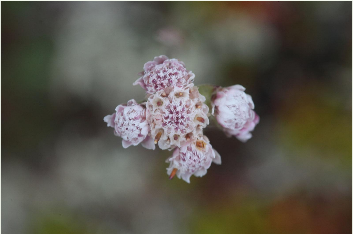
576 - Antennaria dioica