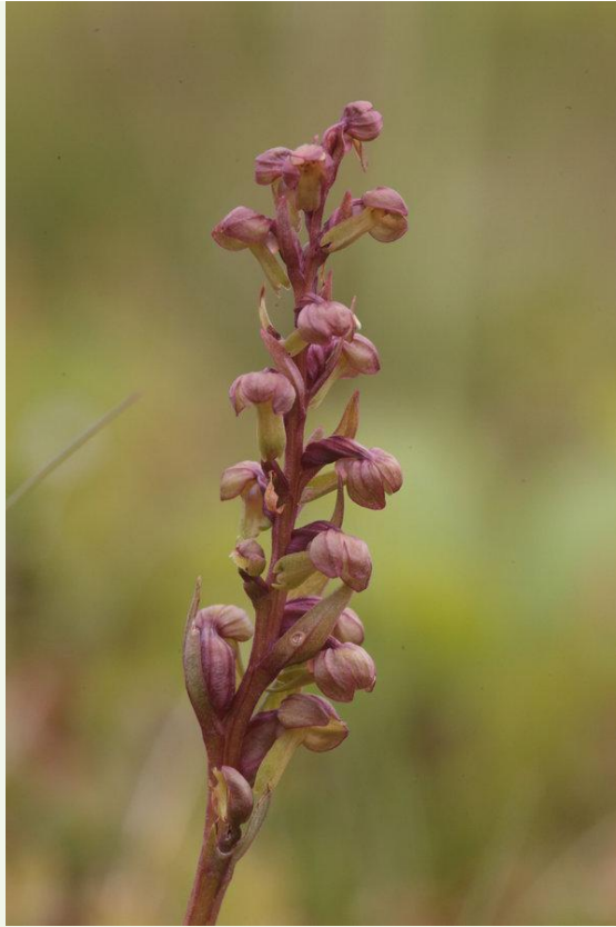
571 - Coeloglossum viride