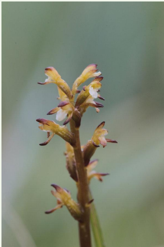
568 - Corallorrhiza trifida