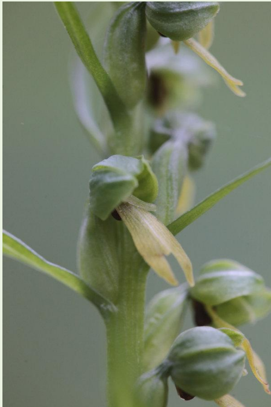
598 - Coeloglossum viride