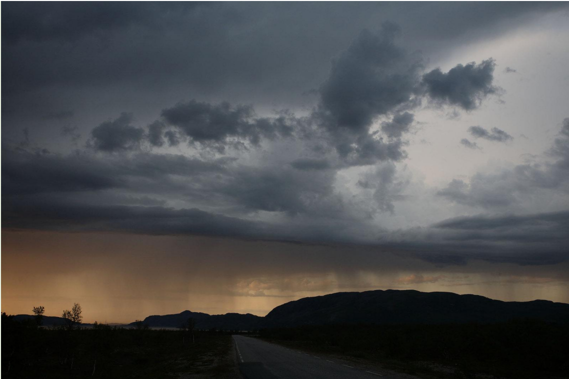
587 - En route vers Alta