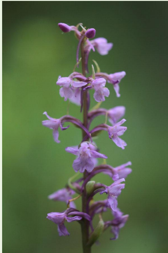
594 - Gymnadenia conopsea