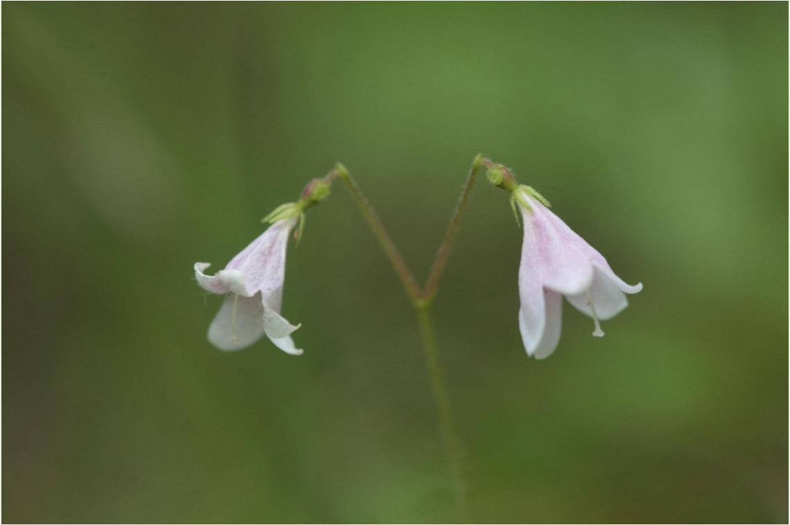
597 - Linnaea borealis