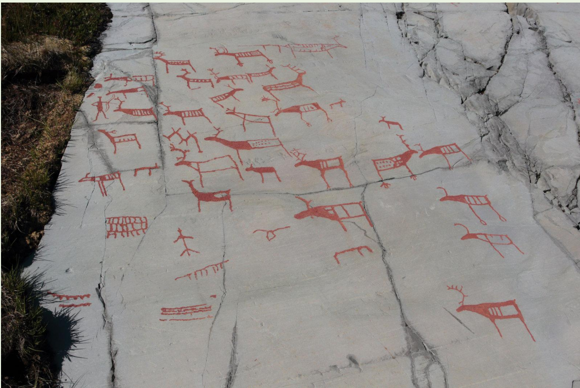
588 - Peintures rupestres à Alta