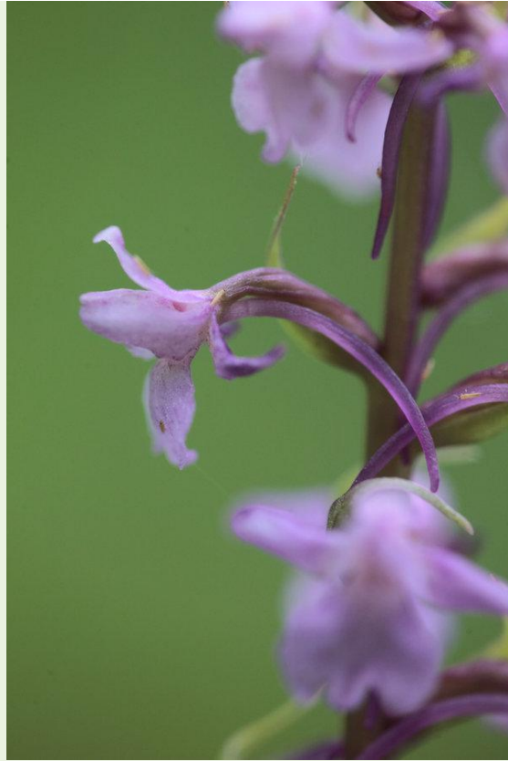
595 - Gymnadenia conopsea