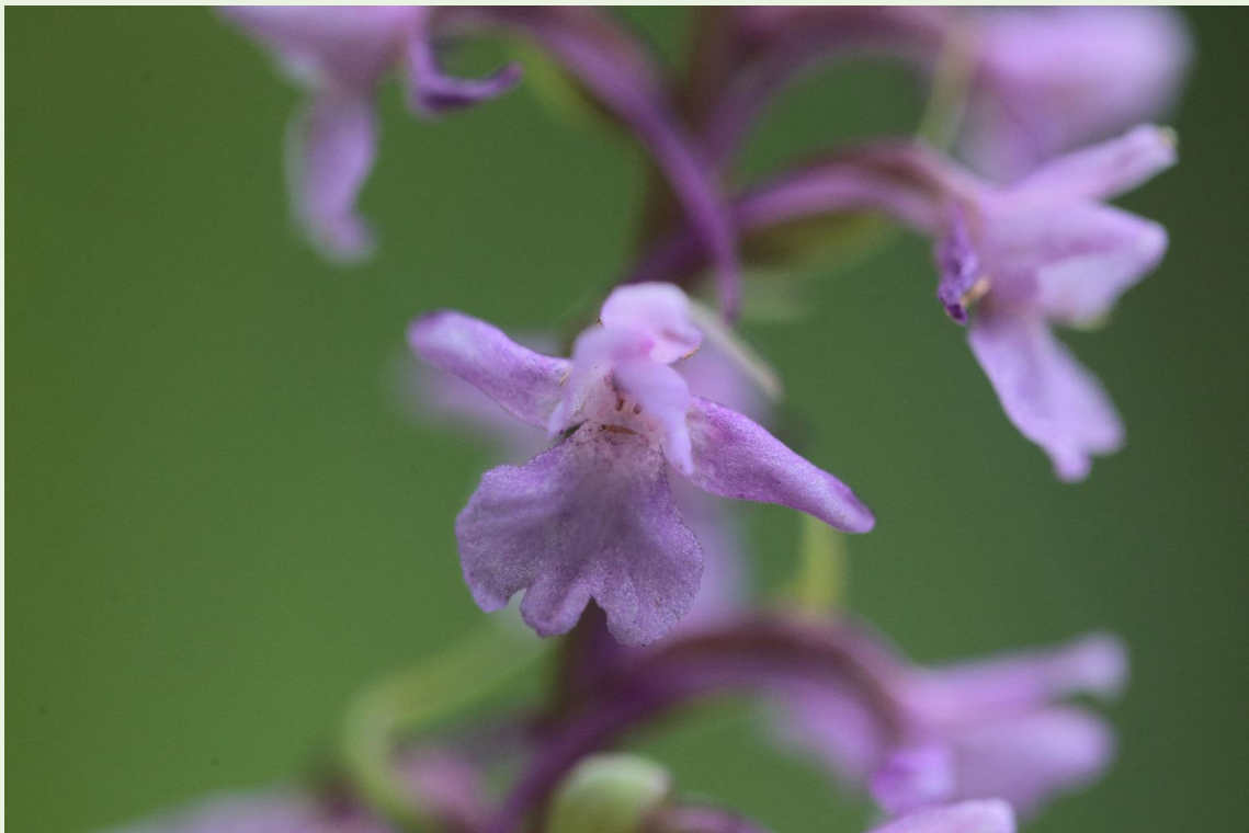
596 - Gymnadenia conopsea