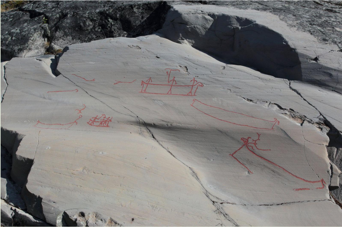
589 - Peintures rupestres à Alta