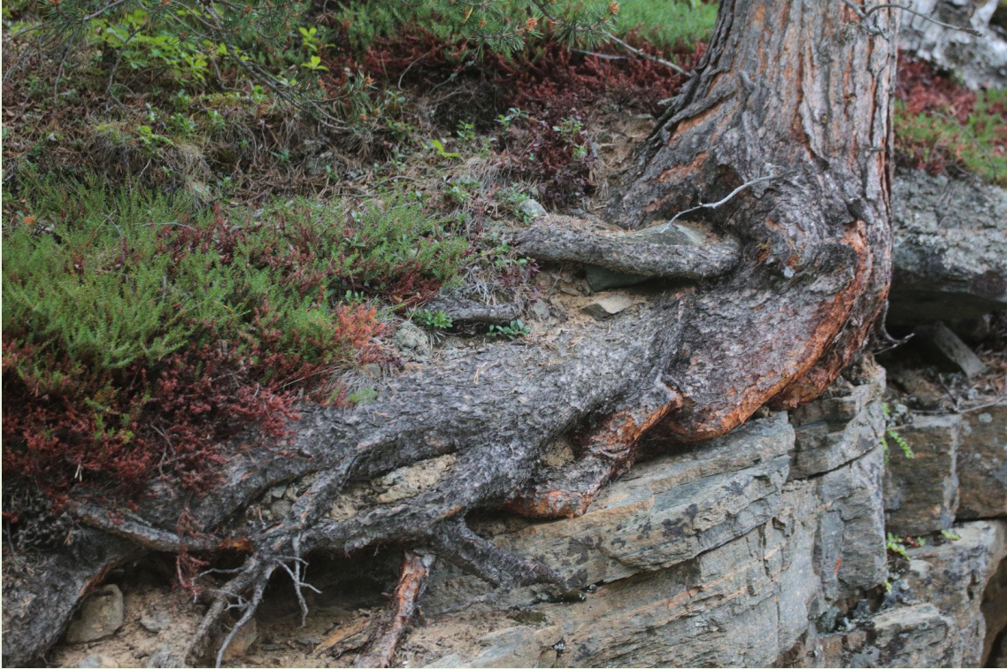
593 - Lullefjellet