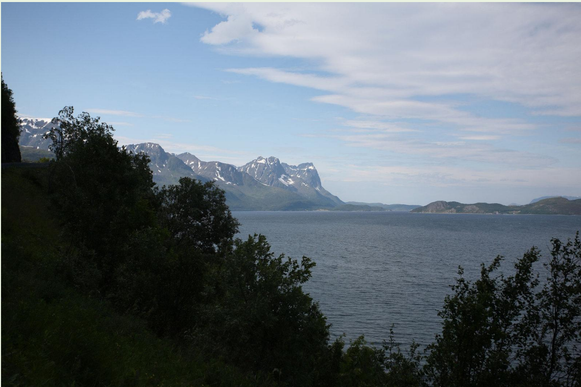
590 - En route