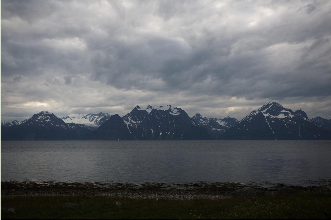
591 - Alpes de Lyngen