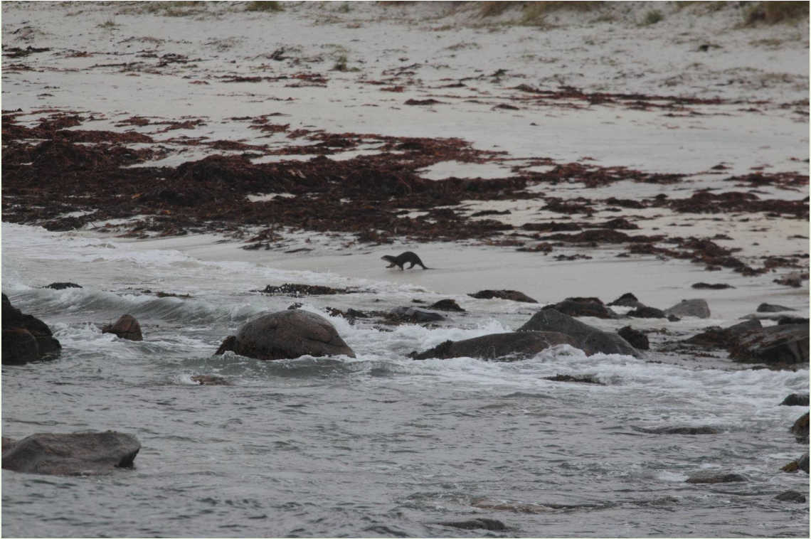
665 - Loutre