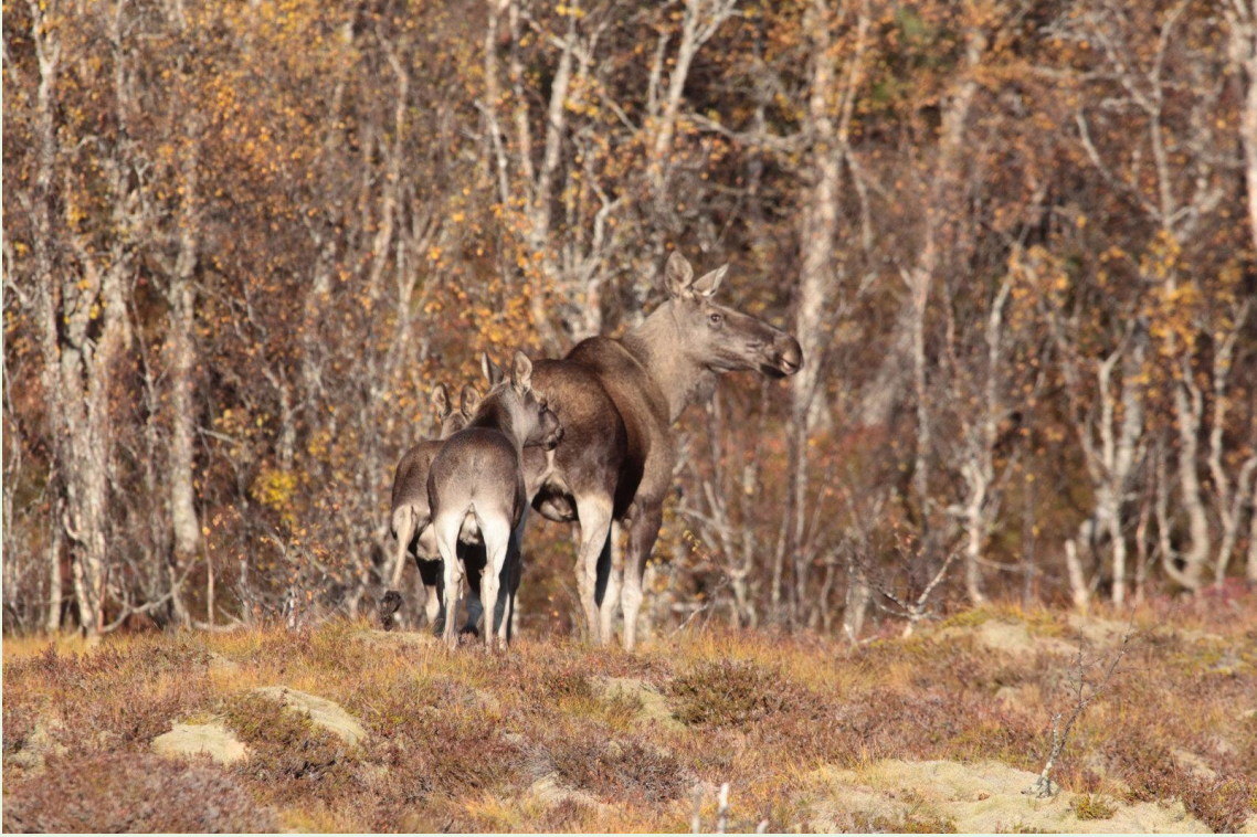
669 - Elan