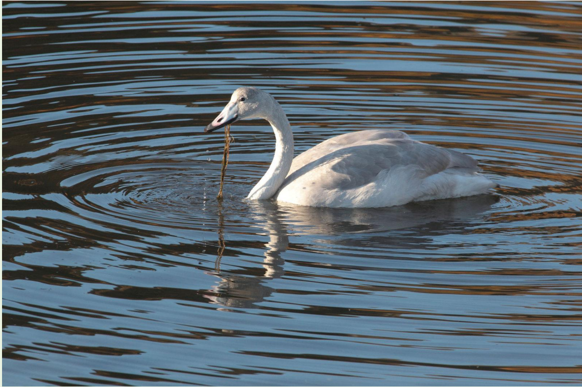
667 - Cygne chanteur