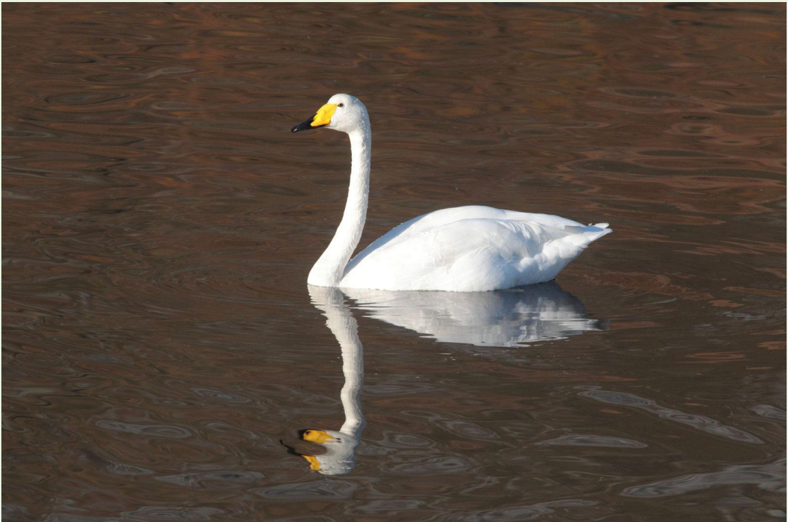
666 - Cygne chanteur