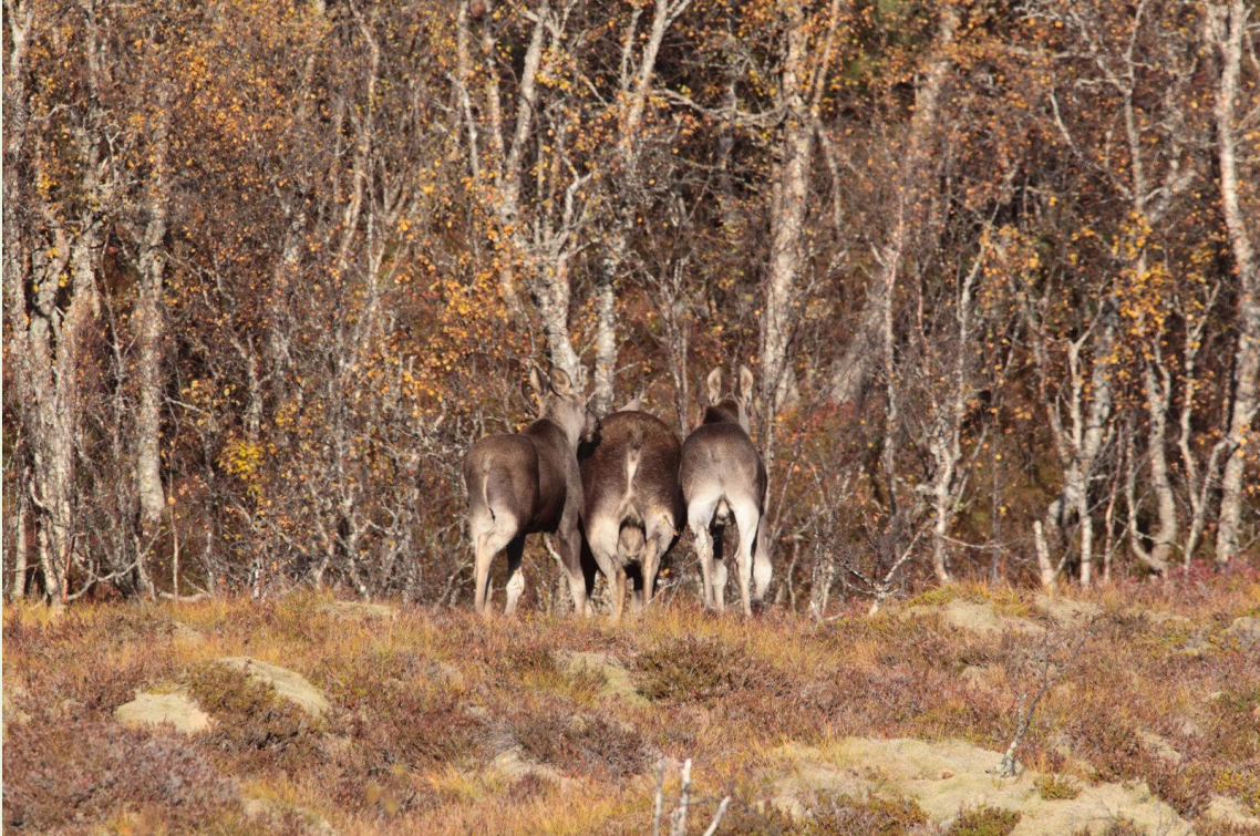
670 - Elan