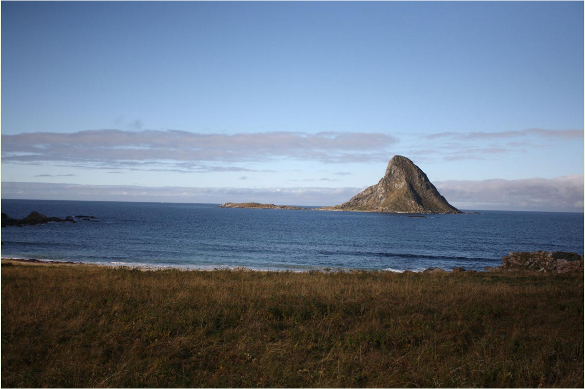
663 - Bleikoya