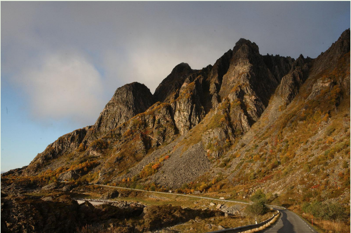
664 - Vesteralen