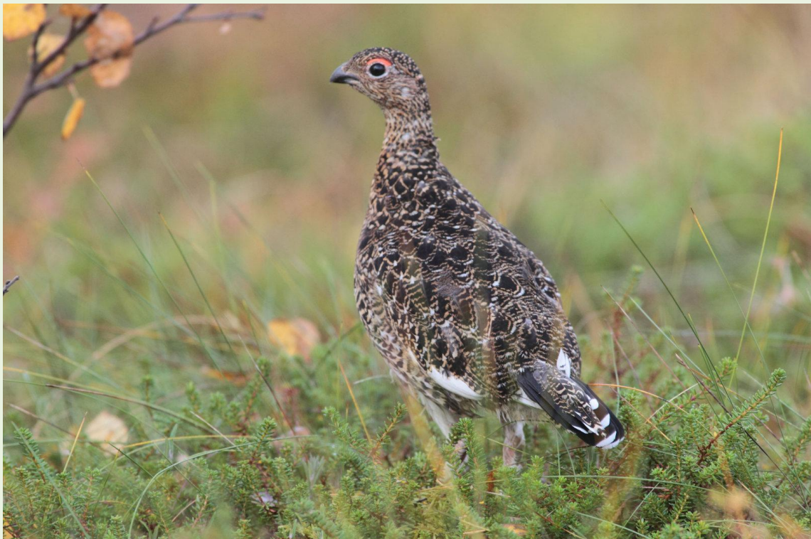
668 - Lagopède des saules