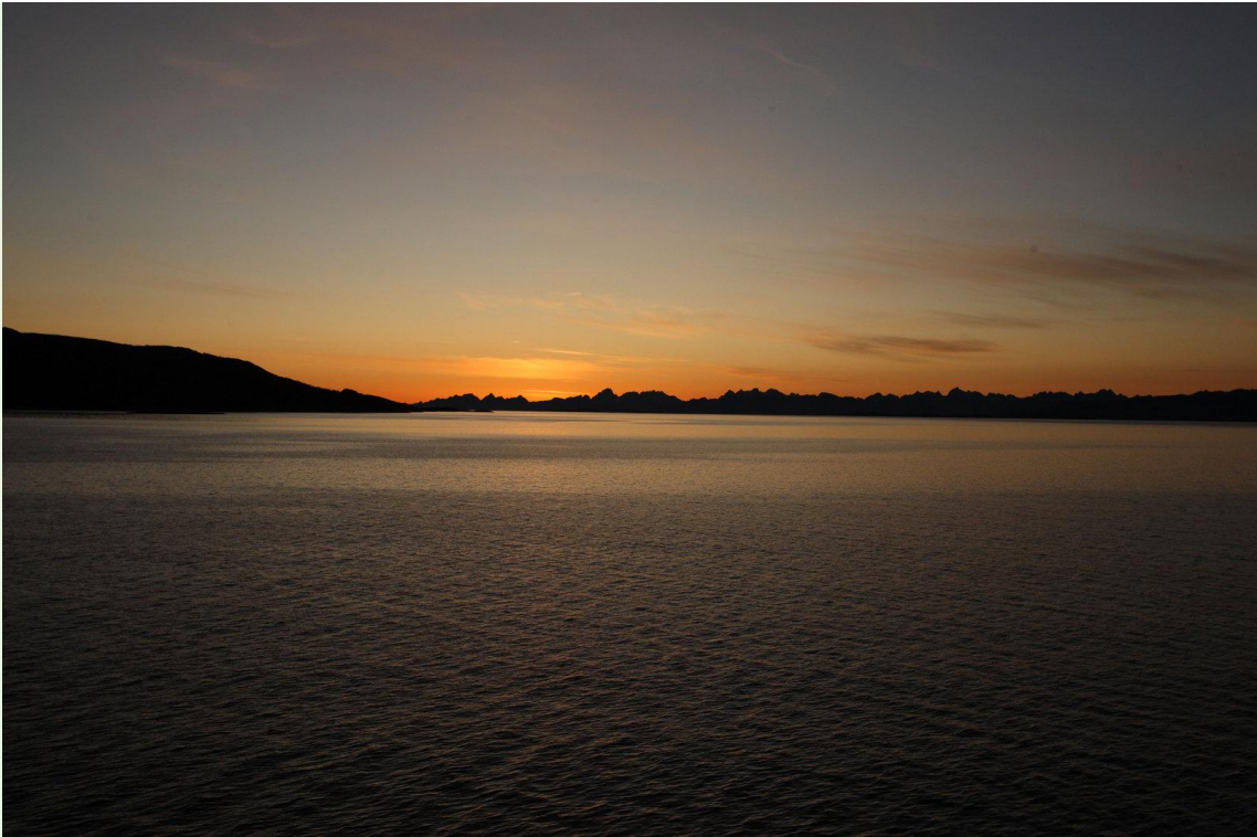
661 - Sur le ferry en route vers les Lofoten

En attendant quelques photos de paysage, de Loure (lointaine), de Cygne chanteur, de Lagopède des saules et d'une femelle Elan avec 2 jeunes.