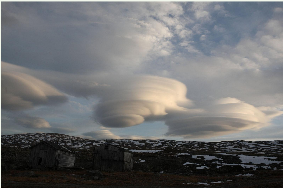
705 - Nuages