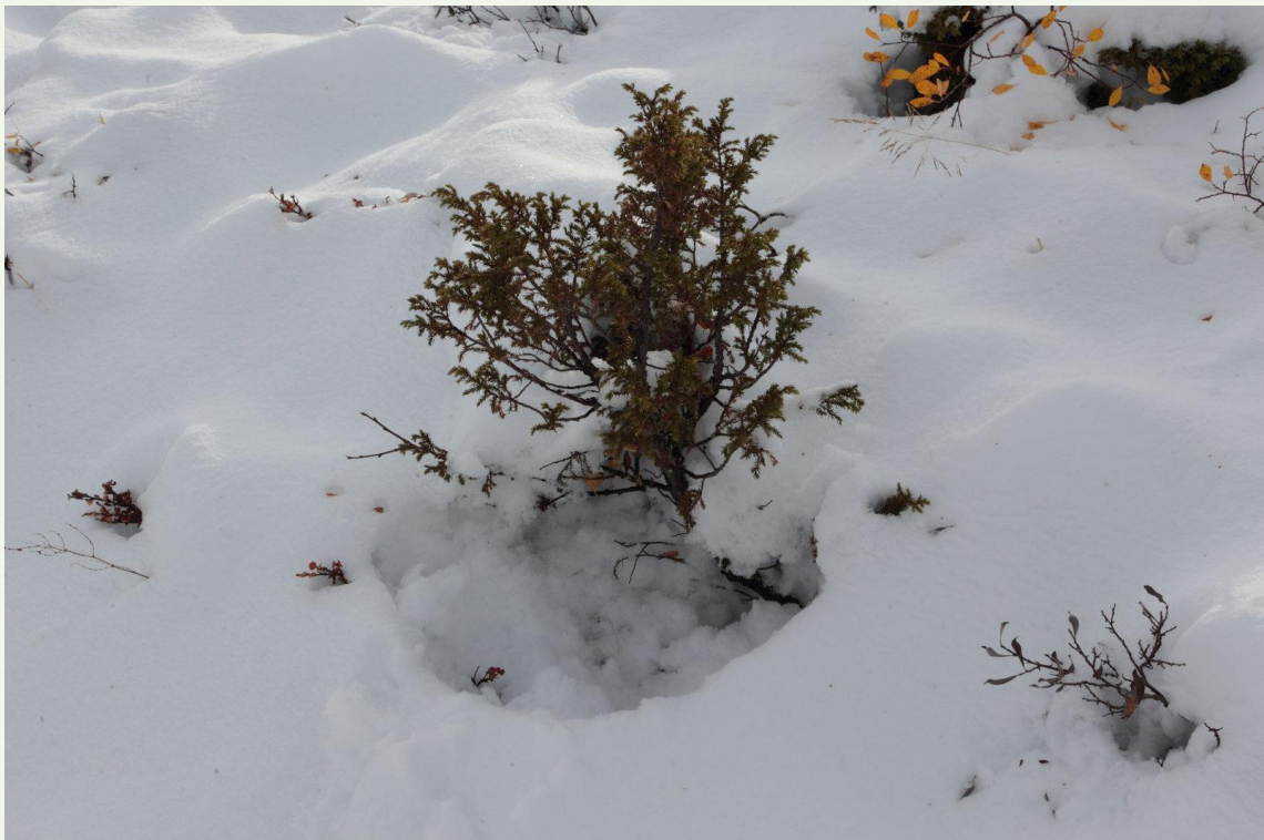
713 - Igloo de Lagopède des saules