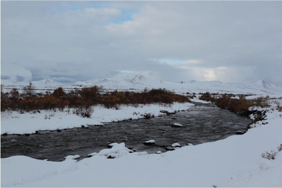
710 - Dovrefjell début octobre