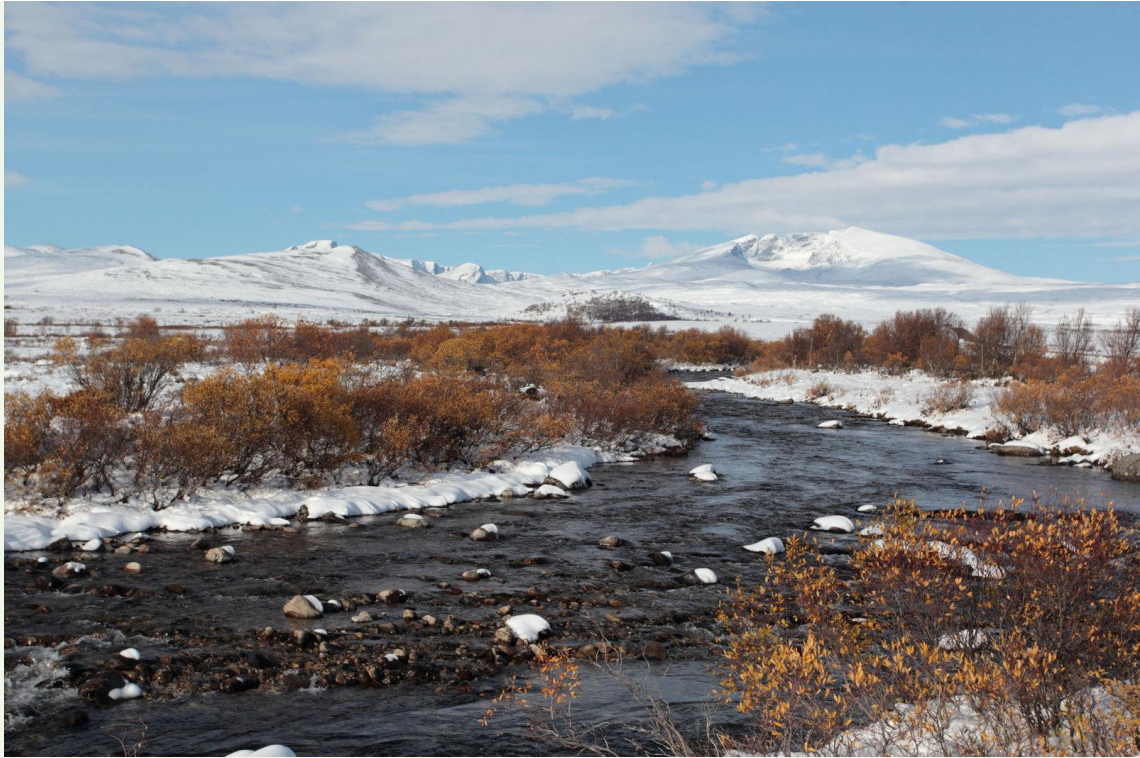
712 - Dovrefjell début octobre