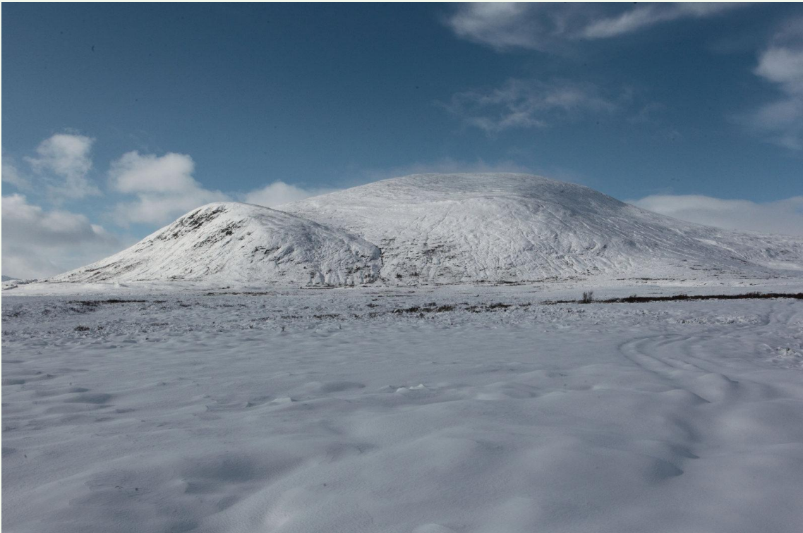
709 - Dovrefjell début octobre