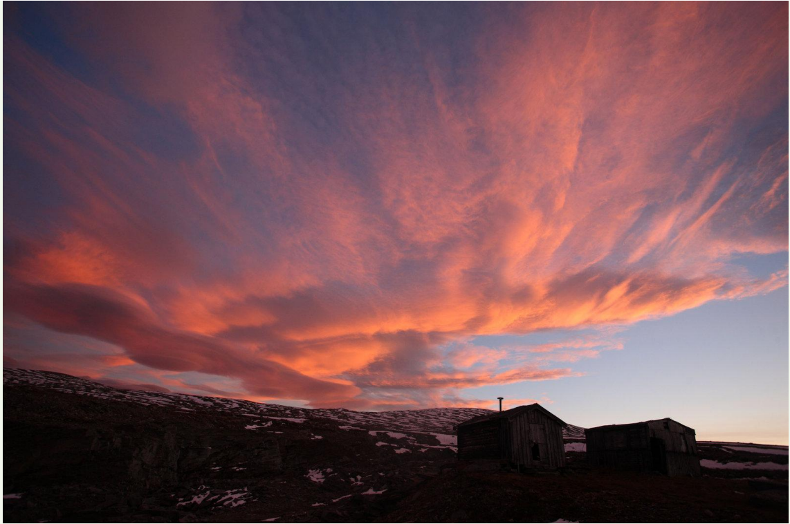
706 - Nuages