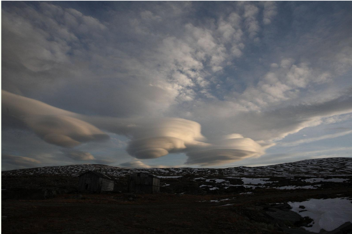
704 - Nuages

Presque la fin de mes séjours 2019 en Scandinavie. Après les Lofoten, je m'arrête de nouveau sur le chemin du retour au Dovrefjell et à Forrolhogna en espérant observer les Boeufs musqués et les Rennes sauvages dans la neige.