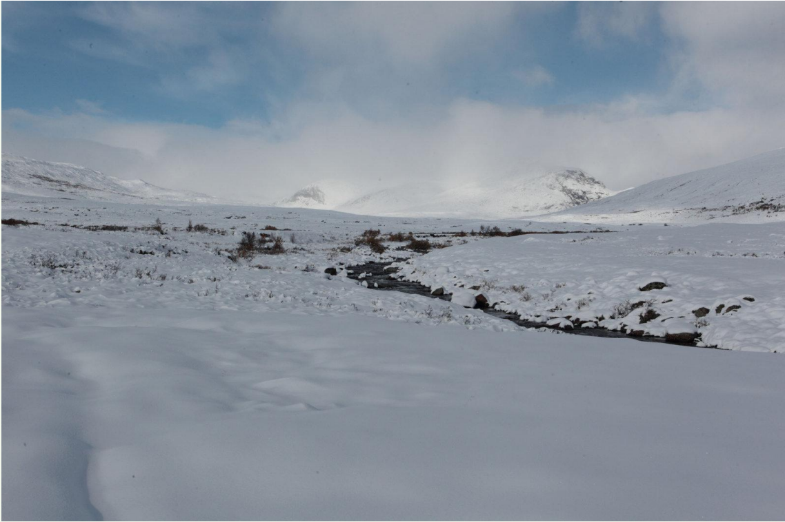
708 - Dovrefjell début octobre