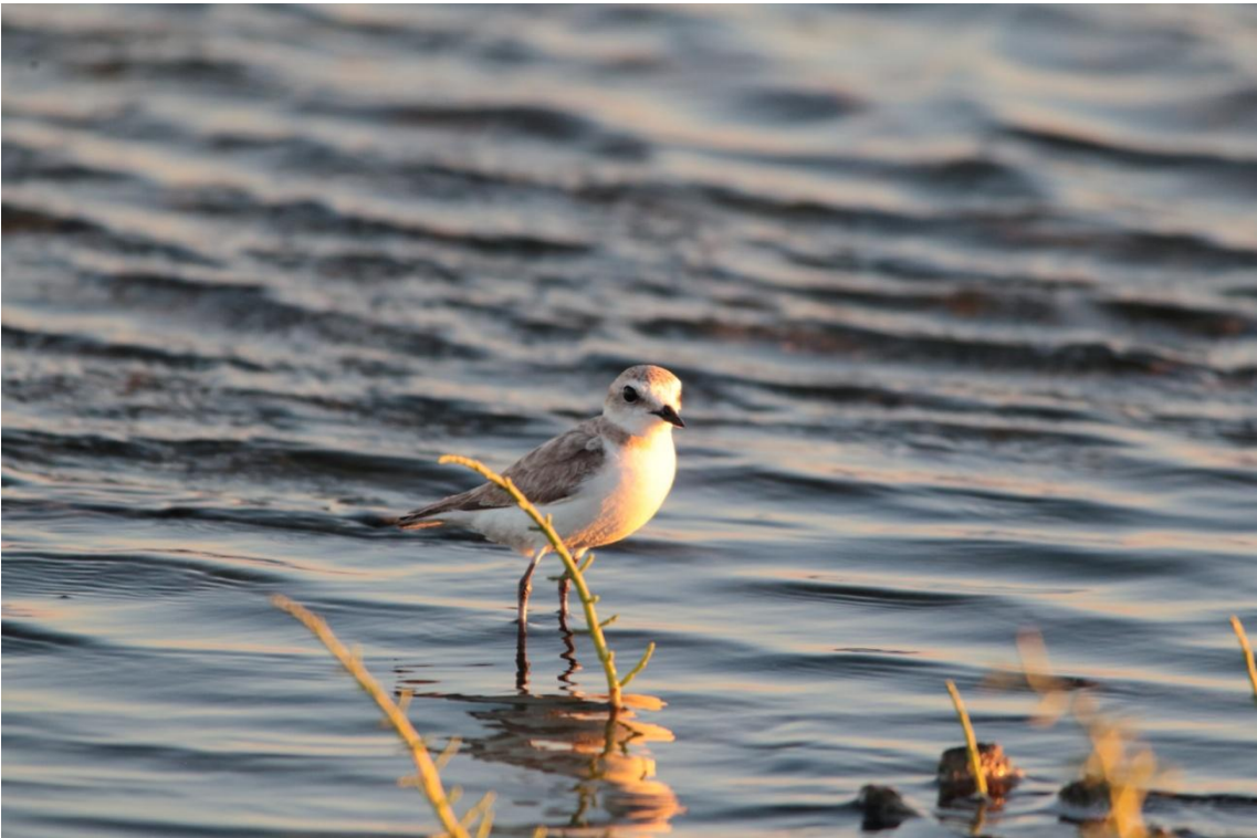
Gravelot à collier interrompu