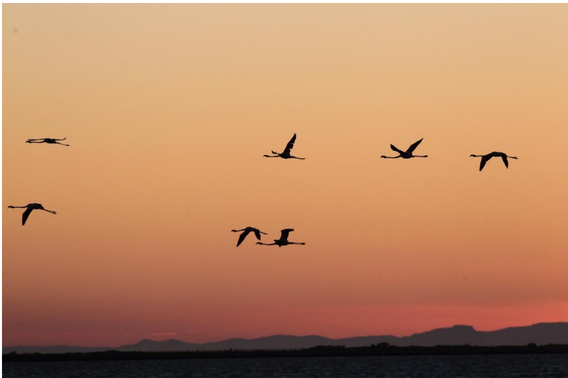
Flamants roses au coucher de soleil