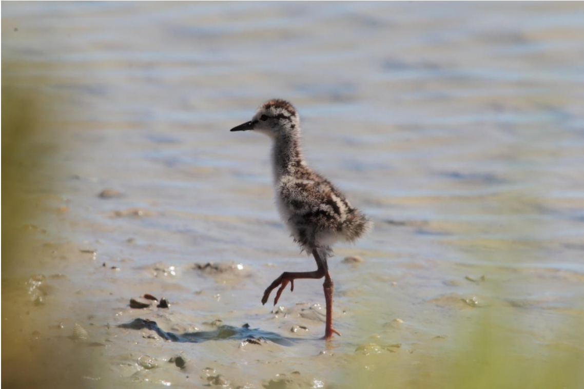
Juvénile de Chevalier gambette