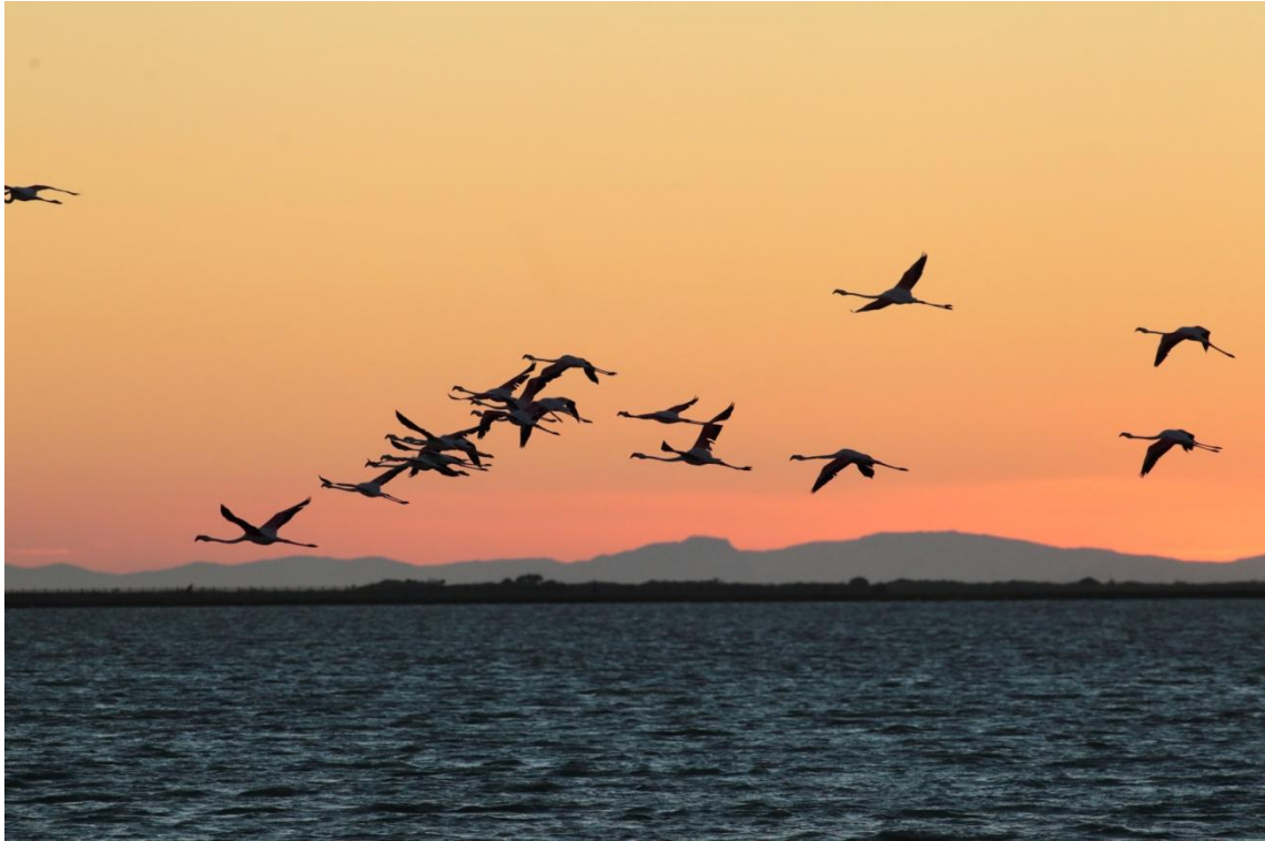
Flamants roses au coucher de soleil