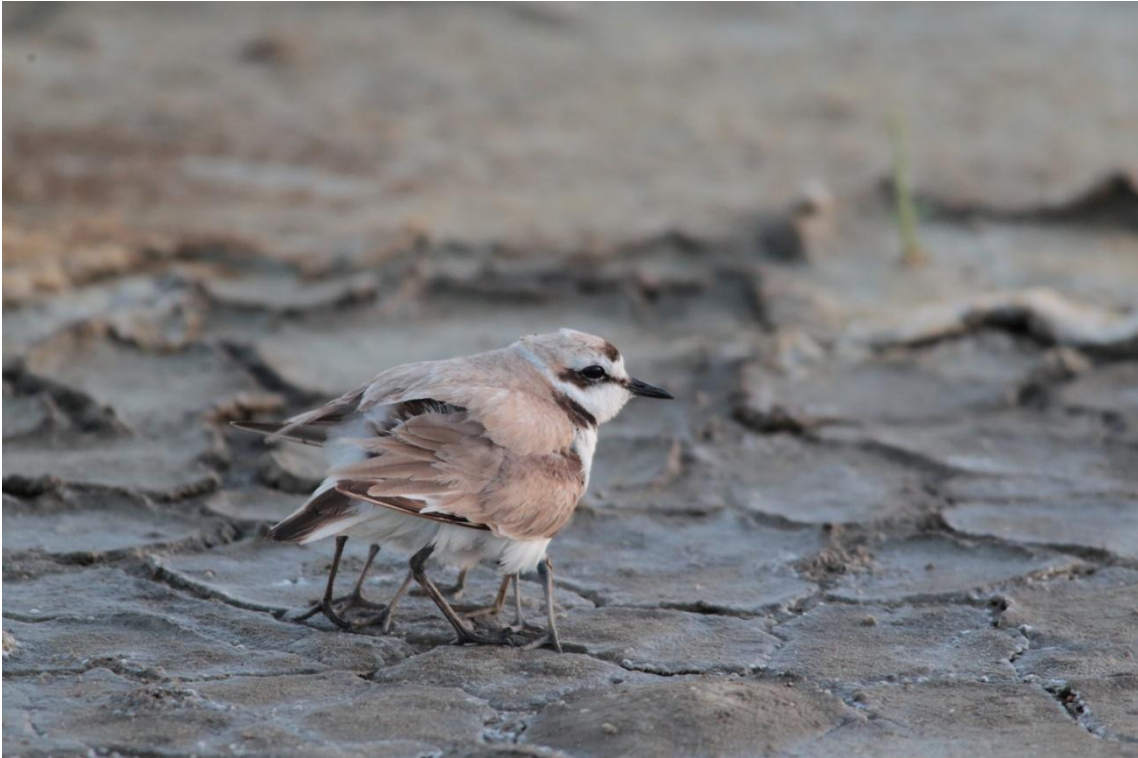
Gravelot à collier interrompu