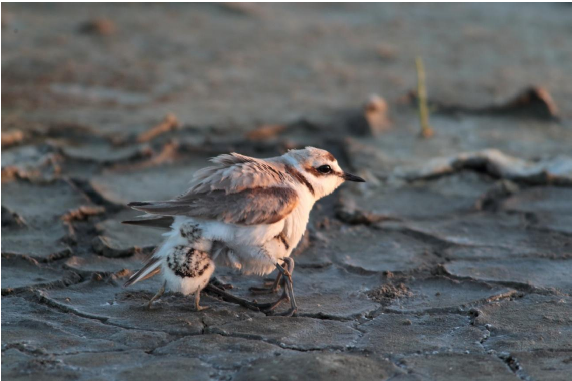
Gravelot à collier interrompu