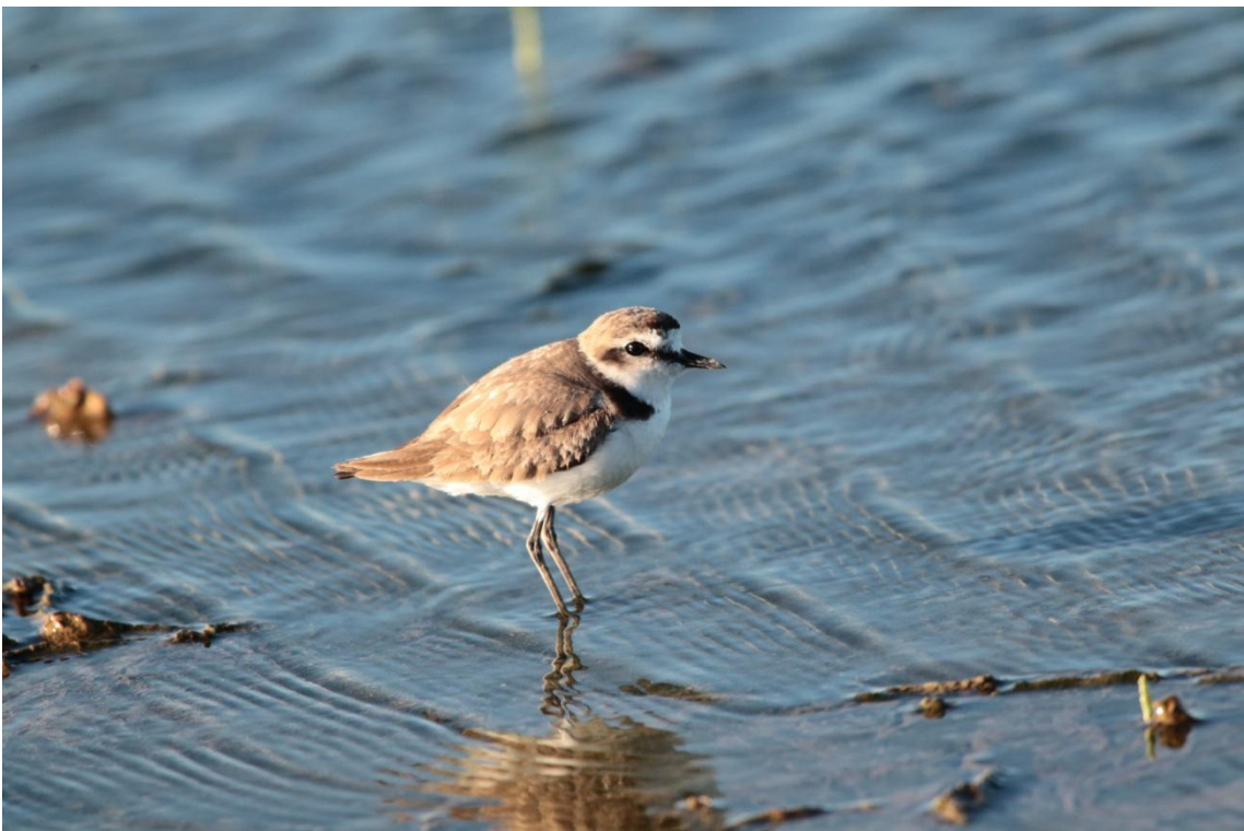
Gravelot à collier interrompu