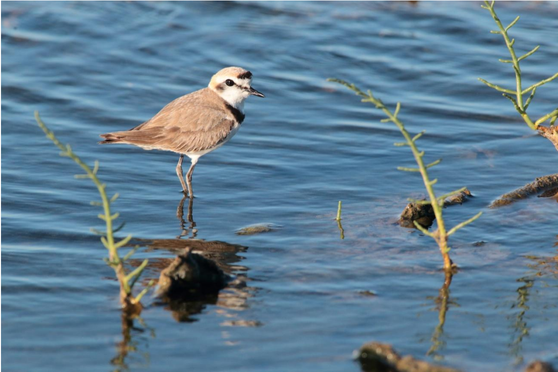
Gravelot à collier interrompu