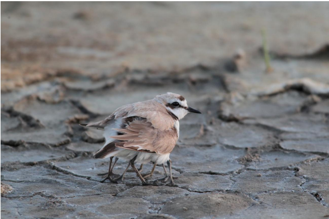
Gravelot à collier interrompu