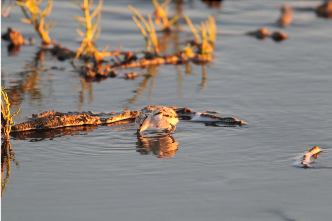
Gravelot à collier interrompu