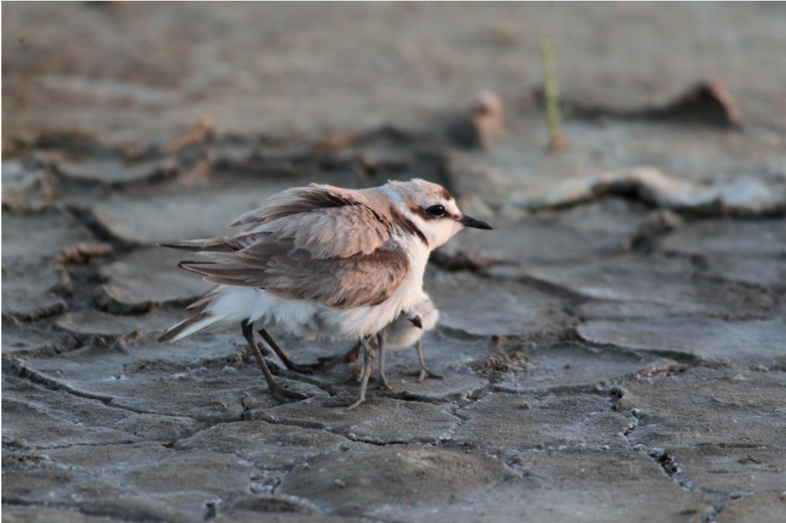
Gravelot à collier interrompu