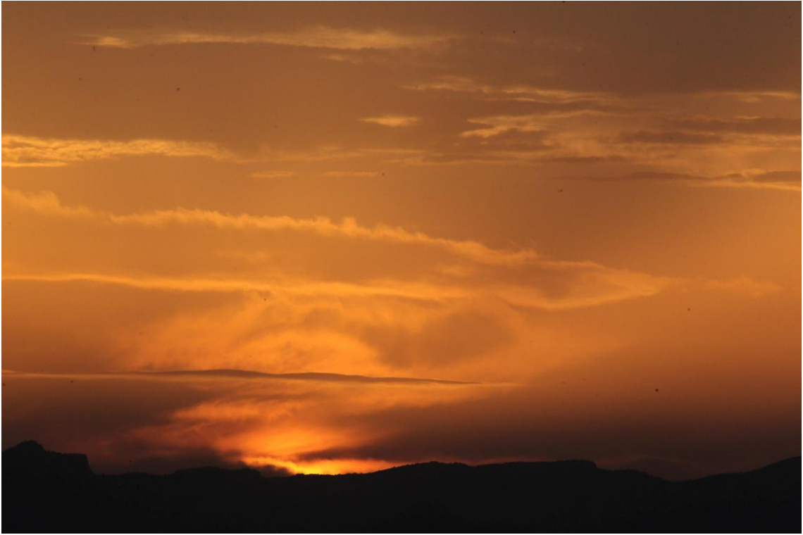
Coucher de soleil