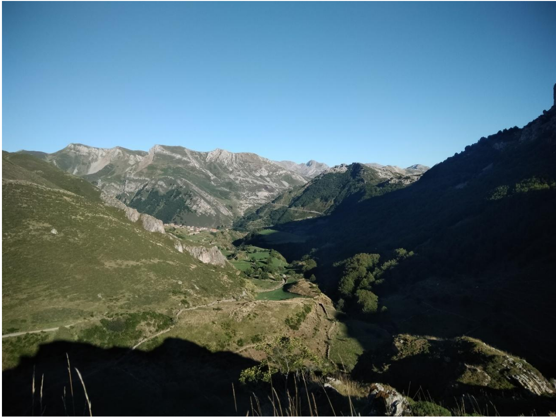
Paysage des Asturies

Pour finir mon séjour en Espagne, je passerai quelques jours dans le secteur de Somiedo pour faire des observations d'Ours brun. Ce fût le cas à partir de points d'observations contrôlés, mais les Ours étaient toujours assez éloignés.