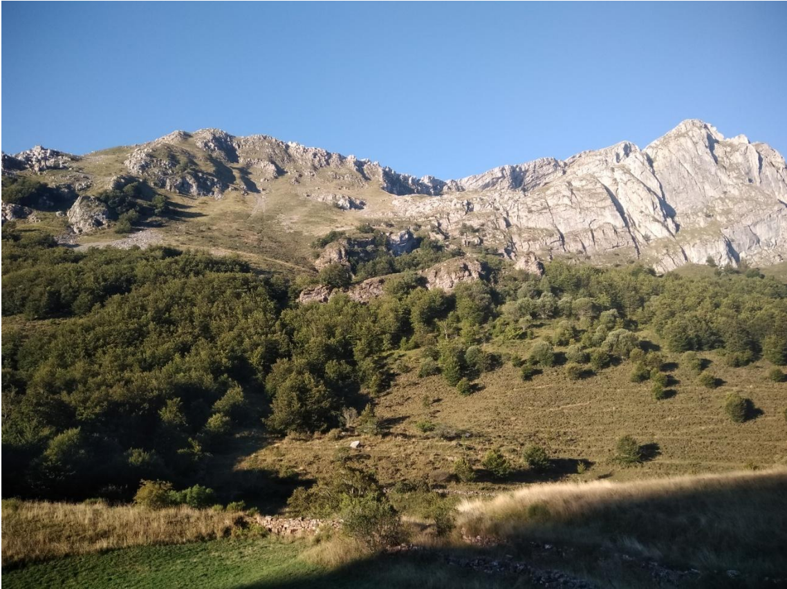
Paysage des Asturies