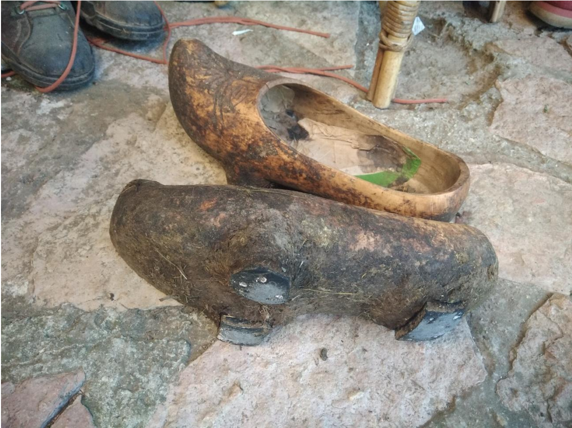
Sabots à plots des Asturies