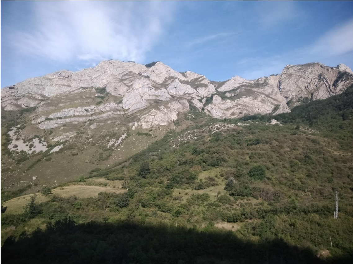
Paysage des Asturies