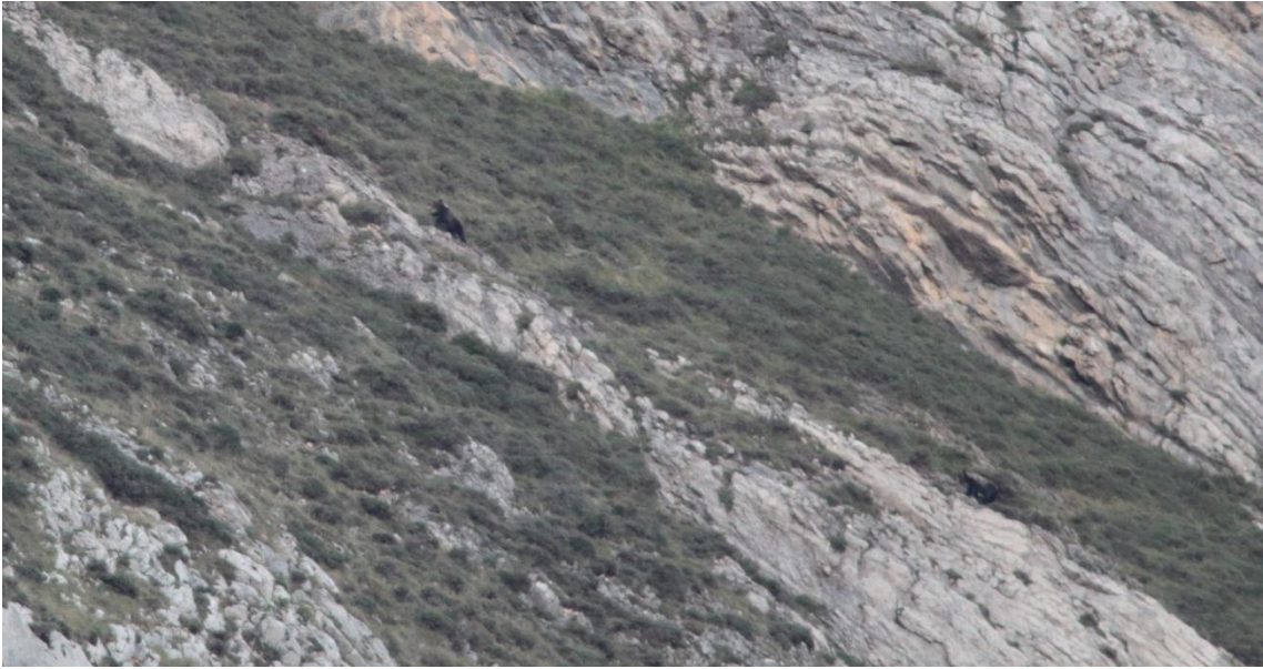
2 Ours bruns