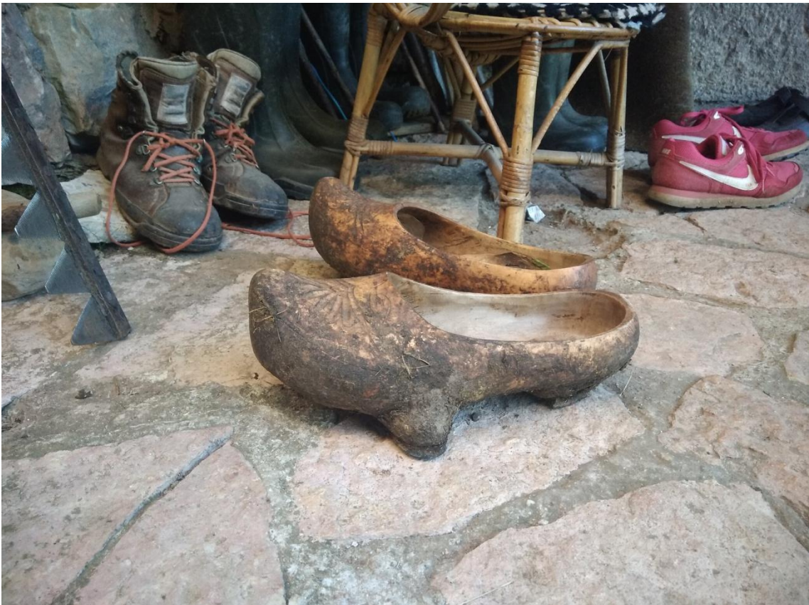
Sabots à plots des Asturies