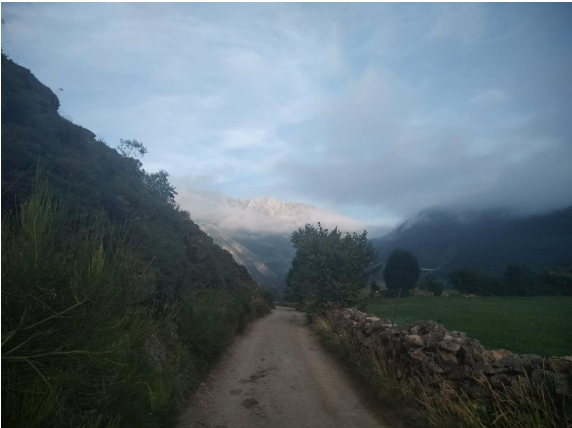
Paysage des Asturies